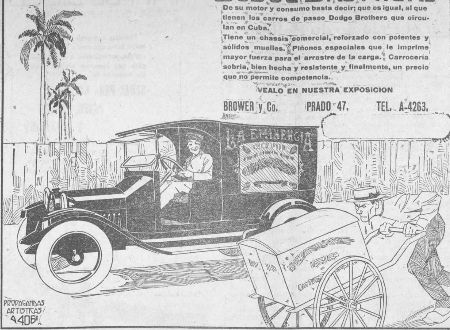
PREPARACIONES ARTISTICAS A 4061

En el segundo, o de la memoria permanente, se hace el número de exposiciones necesarias hasta conseguir que el niño repita los letreros que ha visto sin equivocarse en cuanto al orden en que se le han mostrado.