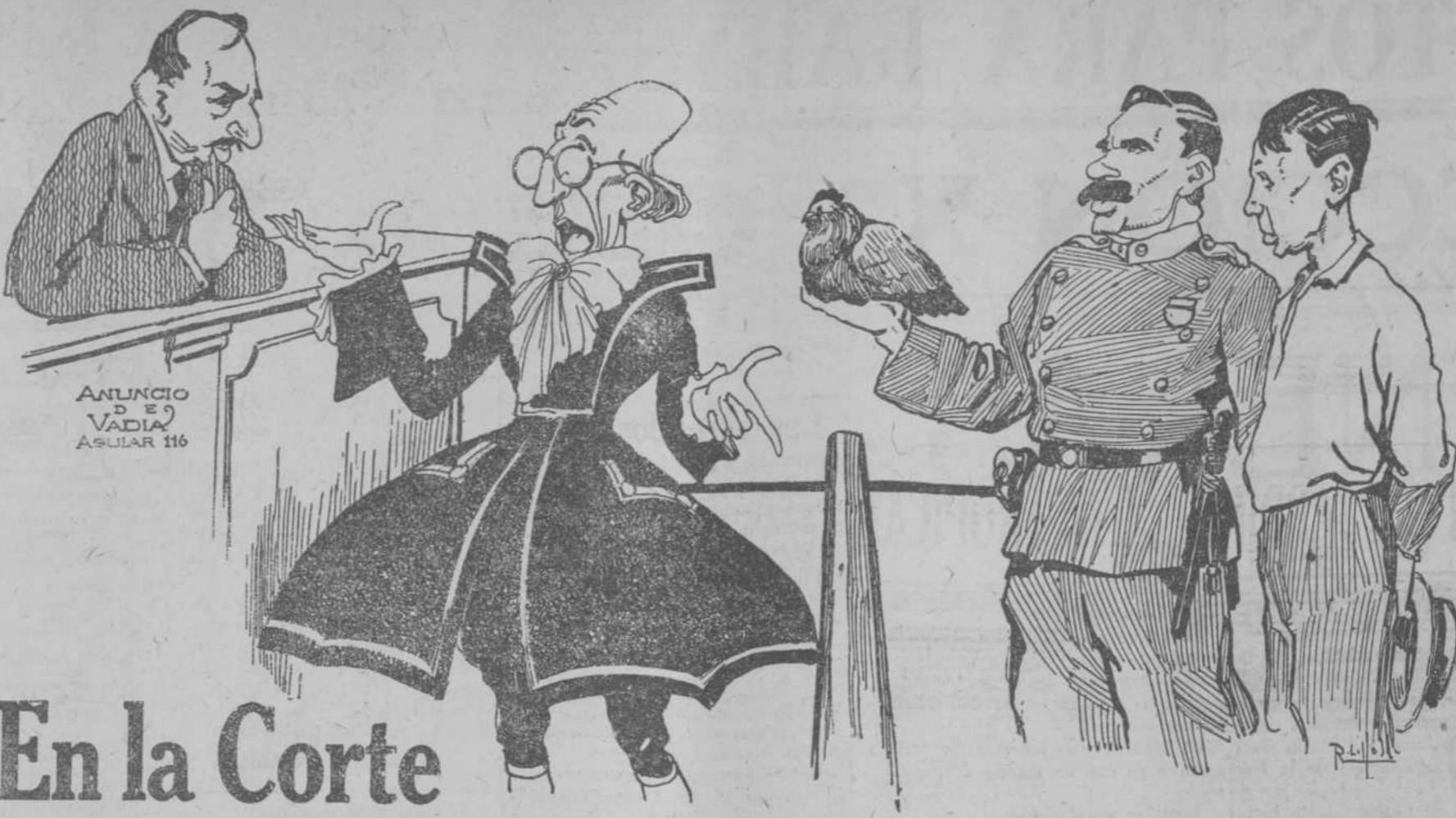
ANUNCIO DE VADIA ASUAR 116