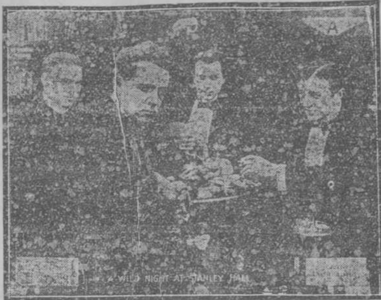
Primos, pero grandes enemigos

Arte, lujo, belleza, interés inusitado, escenas intensas de amor, audacia inverosímil. La vida real llevada al cine de manera magistral. Pida argumento en la Contaduría de Fausto. Representante de esta película para Cuba: Adolfo Roca, San Miguel, 76. Teléfono A-8623. Habana.