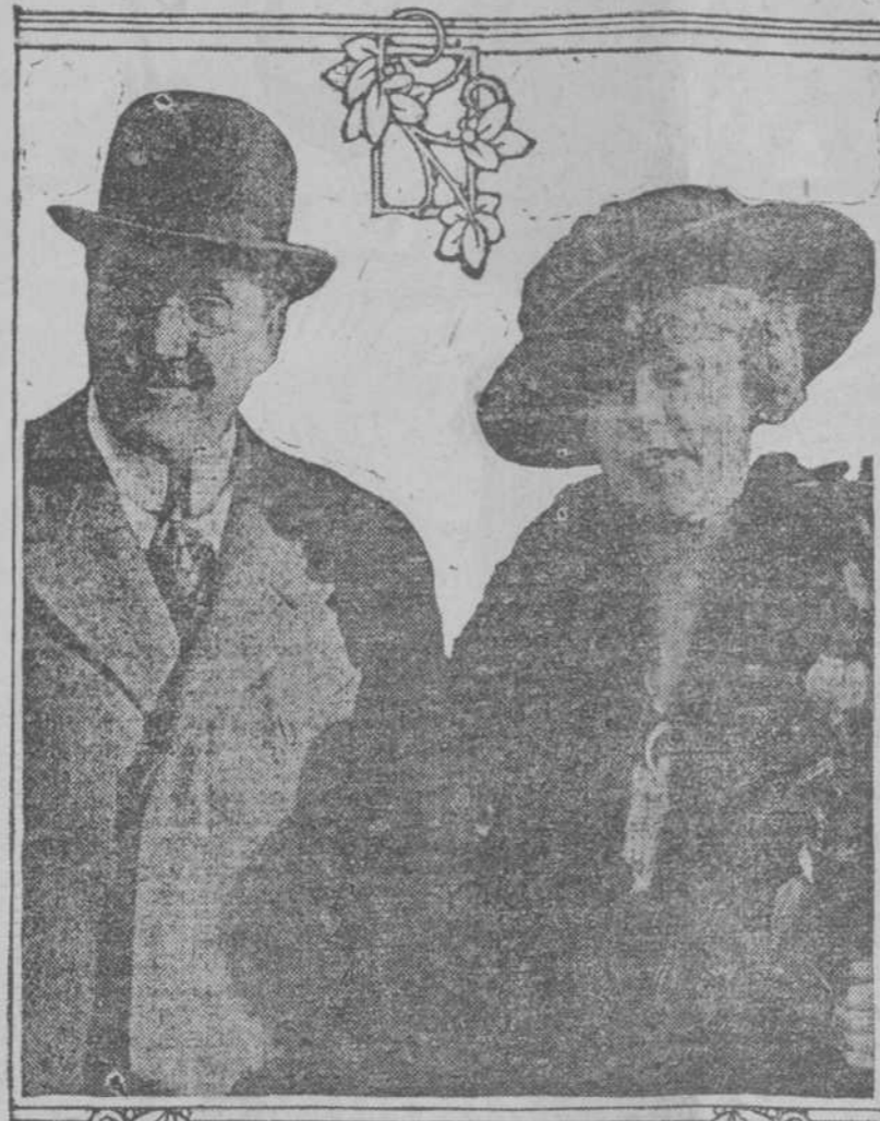
El Embajador de los Estados Unidos en Alemania, cuyo regreso a su país ha dado margen a diversos comentarios y rumores de gestiones pacifistas.