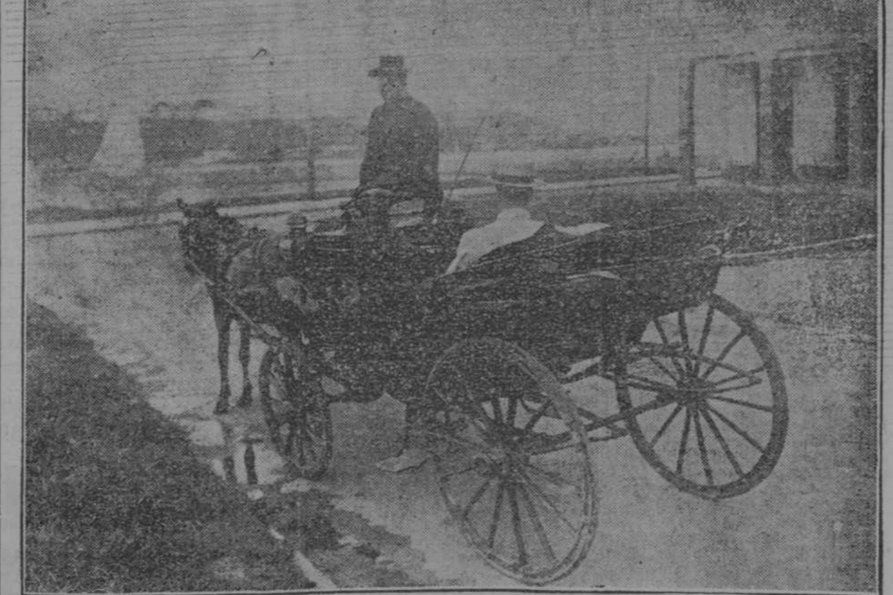
3. —Sigue... hacia el Malecón.

—Voy a decir a usted en qué me fundo: es decir, en qué se funda mi amigo, o mejor, en qué nos fundamos los dos. Hoy todo son automóviles; solamente se fabrican automóviles; de todos precios y para todos gustos y de todas formas; hoy todo el mundo puede tener automóvil, todo el mundo lo tiene... (PASA A LA PAGINA DOS.)