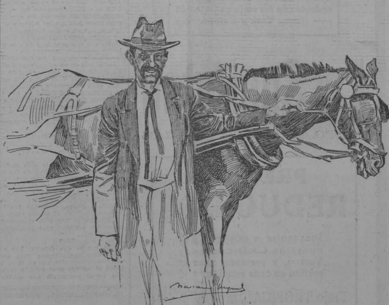
1. ... Acariando al noble bruto