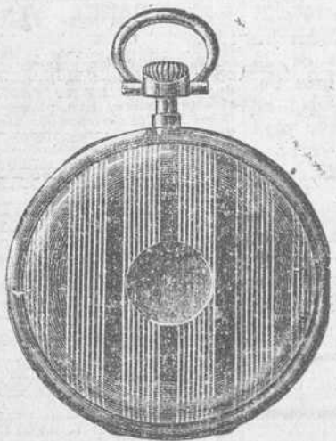
LONGINES, fijos como el Sol.

COMPLETO SURTIDO EN BRILLANTES, SUELTOS Y MONTADOS.