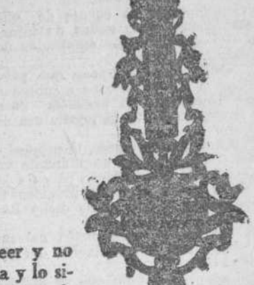
Barómetros en madera tallada. Los hay desde $8.00.

TODOS NUESTROS TRABAJOS SON GARANTIZADOS GARCIA Y HERMANO. "EL ALMENDARES" OBISPO NUMERO 54