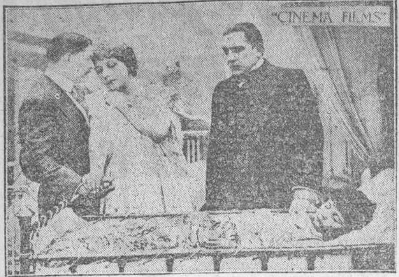
Y mientras su hija agonizaba aquel ingrato iba a buscar las caricias de otra mujer...

Por PATHE-COLORES-G. ROBINNE-PATHE-COLORES