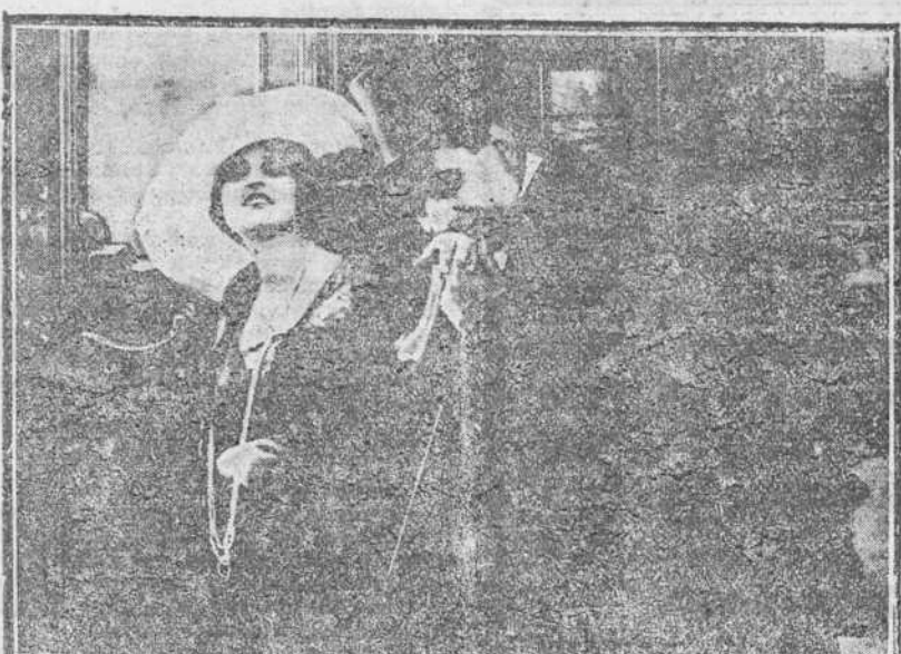
Entre aquellos dos seres huérfanos de dignidad, envilecidos en alto grado, coexistía incolmable el sentimiento de su amor; cualquiera de los dos se sacrificaría por el otro.

El selecto y muy numeroso público que tiene el buen gusto de llenar todos los días los departamentos todos de este teatro, elegante y amplio teatro, tendrá oportunidad de presenciar, en la tercera tanda de la grandiosa función de hoy, Jueves, el estreno de una de las películas más sensacionales y más hermosas que han salido de los talleres de la famosa casa Aquila Film, de Turin. "La Internacional Cinematográfica", que nunca sufre equivocaciones cuando de anticipar juicios de sus películas se trata, nos dice que "El hombre sin nombre", que tal es el título de la película que hoy se estrenará en Fausto, es la que atesora más méritos para figurar en primera línea en su repertorio y bien conocida Serie de Oro. "El hombre sin nombre", consta de 5 actos y mide 2,000 metros, y su éxito será tan enorme como merecido. En primera tanda irán cuatro selectas películas