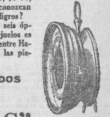
Barómetro con caja de níquel desde $5.00