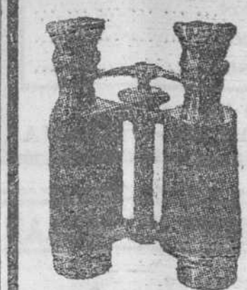
Gemelos prismáticos "Zeiss" para campo, teatro y marina.

¿Acaso se podrán comprar otros si la vista llegara a faltar?