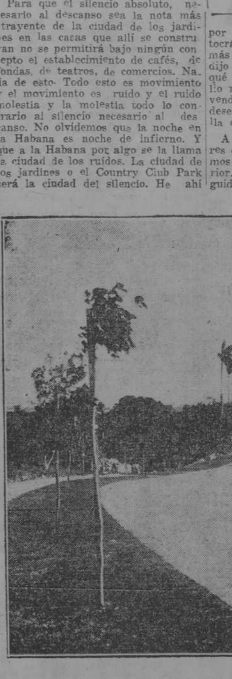
CONSTRUCCION DE JARDINES DE EL COUNTRY CLUB PARK

(Viene de la primera.) do lo que distingue a los espíritus refinados de la vulgaridad. Se lucha y se trabaja durante el día en la ciudad; por la noche se huye de la ciudad para ir al campo en busca del verdadero descanso, de la soledad que conforta, del silencio que acrisa, la sociabilidad agradable y culta.