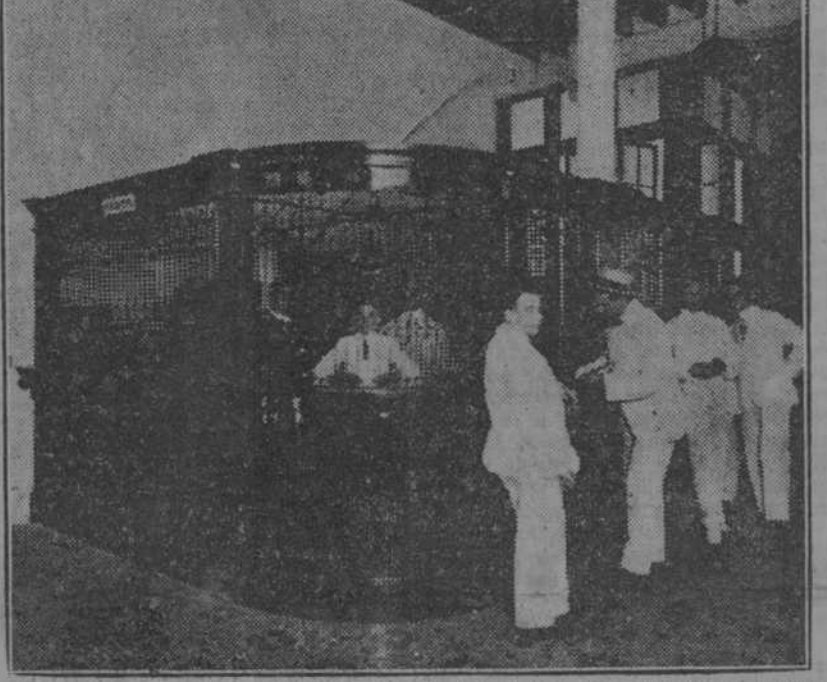
CONCURRENCIAS A LA INAUGURACION DE LA SUCURSAL DEL BANCO NACIONAL DE CUBA, DE LA CALLE DE BELASCOAIN.—INTERIOR DE LA SUCURSAL