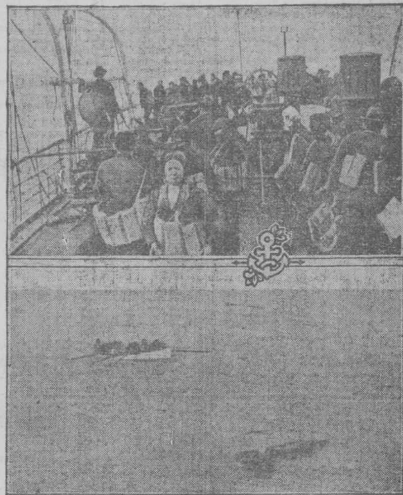
EL SUSSEX. — Fotografías tomadas a bordo de este buque, por una pasajera, momentos antes de ser torpedeado y a raíz del hundimiento del trasatlántico.