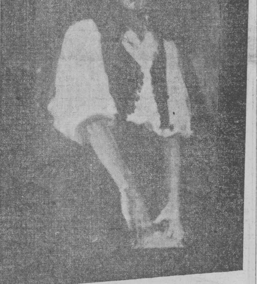
"Joven húngara" por Concepción Ferrán. (Primer premio.)

La visita a la Exposición que el 14 de esta edición, publicó DIARIO DE LA MARINA daba la reseña sugerida por las salas de Escultura y Paisaje.