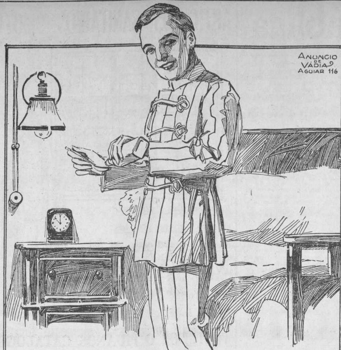
ANUNCIO VADIAZ AGUIAR 116