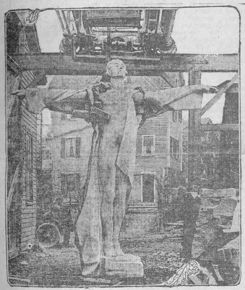
Estadua que se está terminando en Quincy, Mass., y que se colocará en el parque Potomac, en Washington, como recuerdo a las víctimas del Titanic.