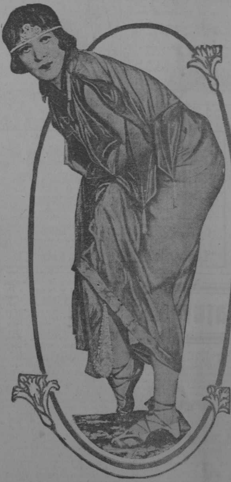
UNA BARONESA MODELO

Agencia del DIARIO DE LA MARINA en Cerro y Jesús del Monte. Teléfono 1-1234.