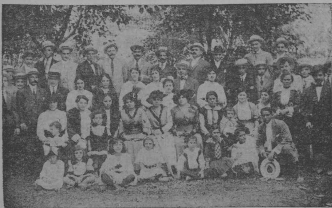
DE LA BRILLANTE MATINEE CELEBRADA AYER POR EL CLUB TINETENSE, EN LA POLAR. EN LA PRIMERA EDICION DE MAÑANA PUBLICAREMOS LA CRONICA DE DON FERNANDO, NO HACIENDO EN LA PRESENTE EDICION POR FALTA DE ESPACIO