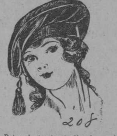
Boina de terciopelo listado, cordón y borlas por adorno. Precio: $4.25.

Precio desde $4.25. Precio desde $4.50. Precio desde $5.98.