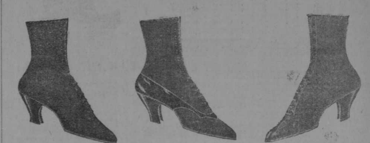
Terciopelo azul, $7.50. Terciopelo negro con talonera charol y vivos blancos, $7.50. Terciopelo carmelita con tirillas glacé bronceado, $7.50.