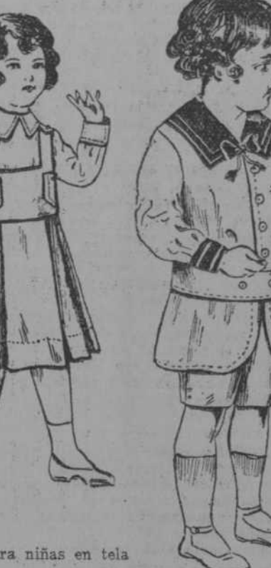
Precioso traje de jerga en azul prusia pastel y carmelita. Para 4, 6 y 8 años. Es de los últimos y más elegantes modelos recibidos.

VESTIDOS de Seda, para Señoras y Niñas ¡Muy finos!