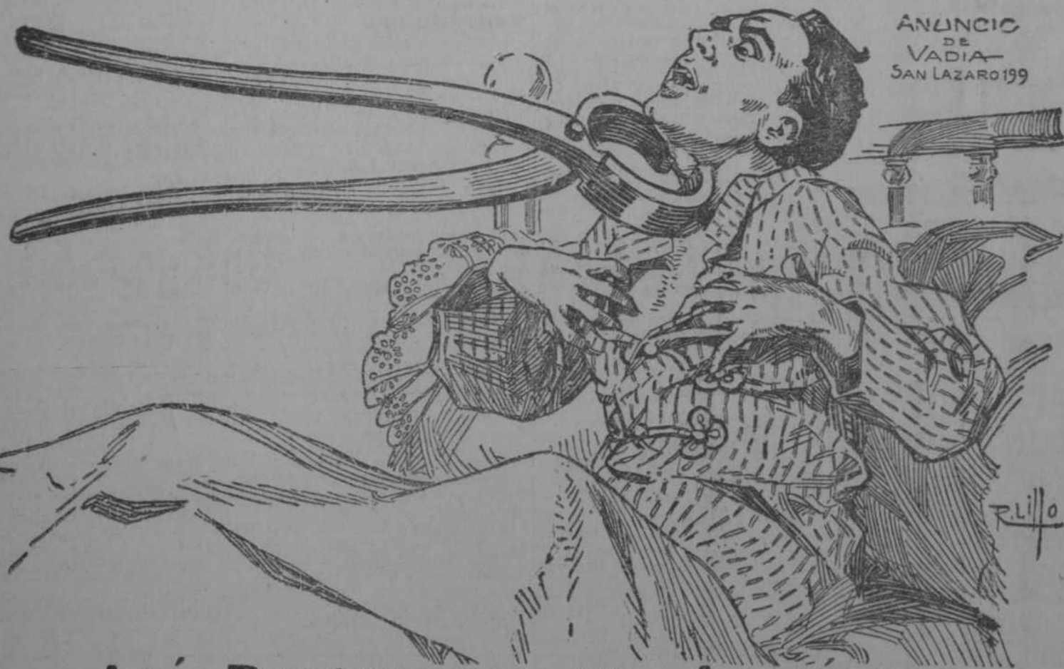
ANUNCIO DE VADIA SAN LAZARO 1919

"EL BRAZO FUERTE" GALIANO, 132. TELEFONO A-4944