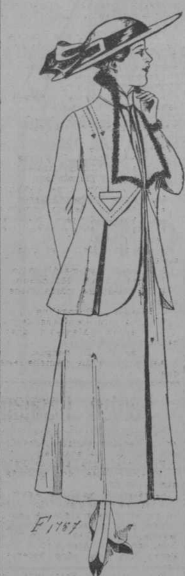
Traje sastre de hermosa gabardina negra o gris, chaqueta forma vasca con pliegues, chalco otomano, corbata terciopelo. Guarnición de buena imitación piel.

BLUSAS de Chiffon, Moaré y Seda ¡Bellísimas! ABRIGOS Modelos especiales de esta casa, para Señoras, jovencitas y niñas GORRAS de automóvil muy coquetonas, de gasa y seda, todos colores.