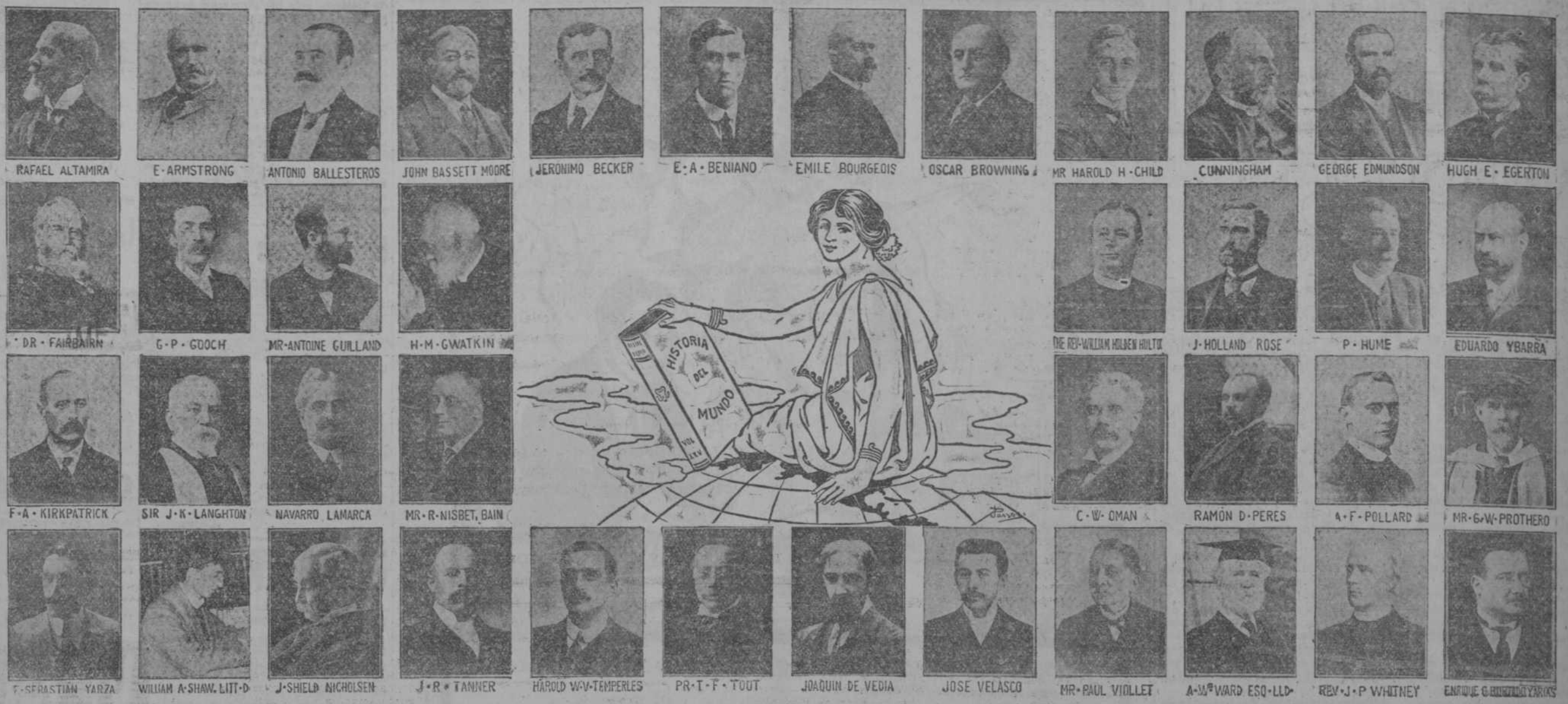
Cuarenta de los ciento setenta y un autores que han hecho esta obra magna de erudición.

La lista completa de los CIENTO SETENTA Y UN AUTORES podrá verse en nuestro folleto descriptivo. Por no fatigar al lector, no lo publicamos aquí