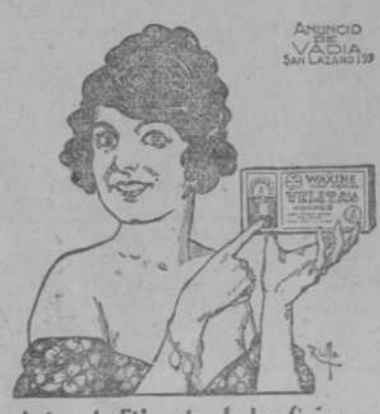
Así es la Etiqueta de las Cajas de VELITAS WAXINE.

BULGARIA Y GRECIA. Berlin, 28. Dicese que si la ocupacion de Monastir llega a ser necesaria, los búlgaros prometerán de una manera clara y definida a Grecia que esa ocupacion solo será temporal y conse-