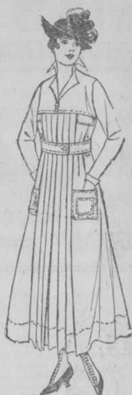
A Favored Tailored Dress of Serge McCall Pattern No. 6797, one of the many new designs for November.

Vestidos de lana y seda, desde $12.00 a $20.00