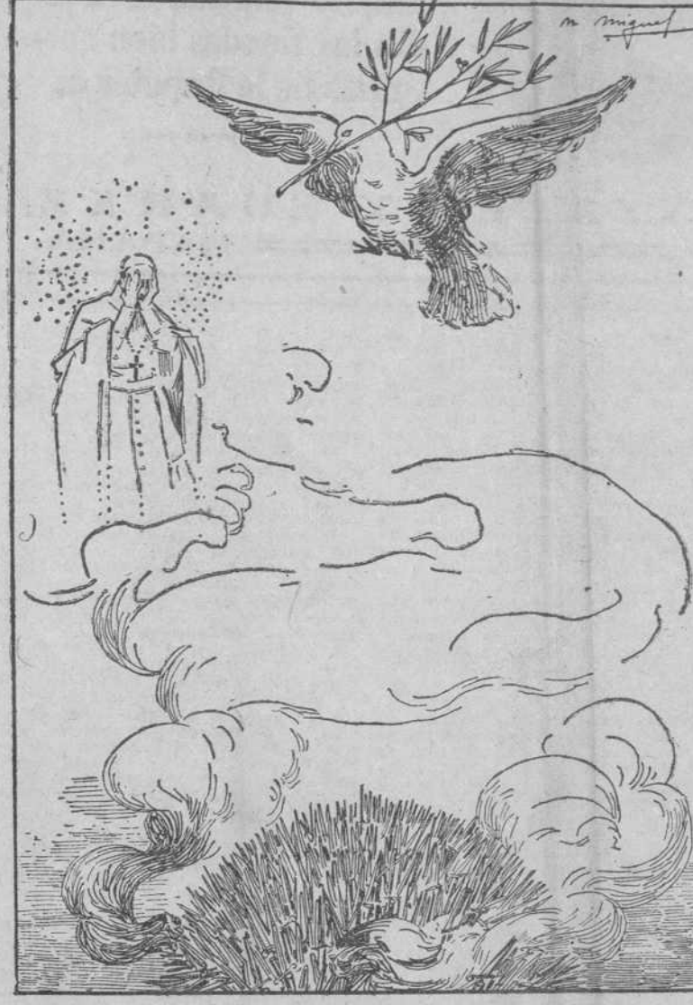
EL PONTIFICE LLORA...