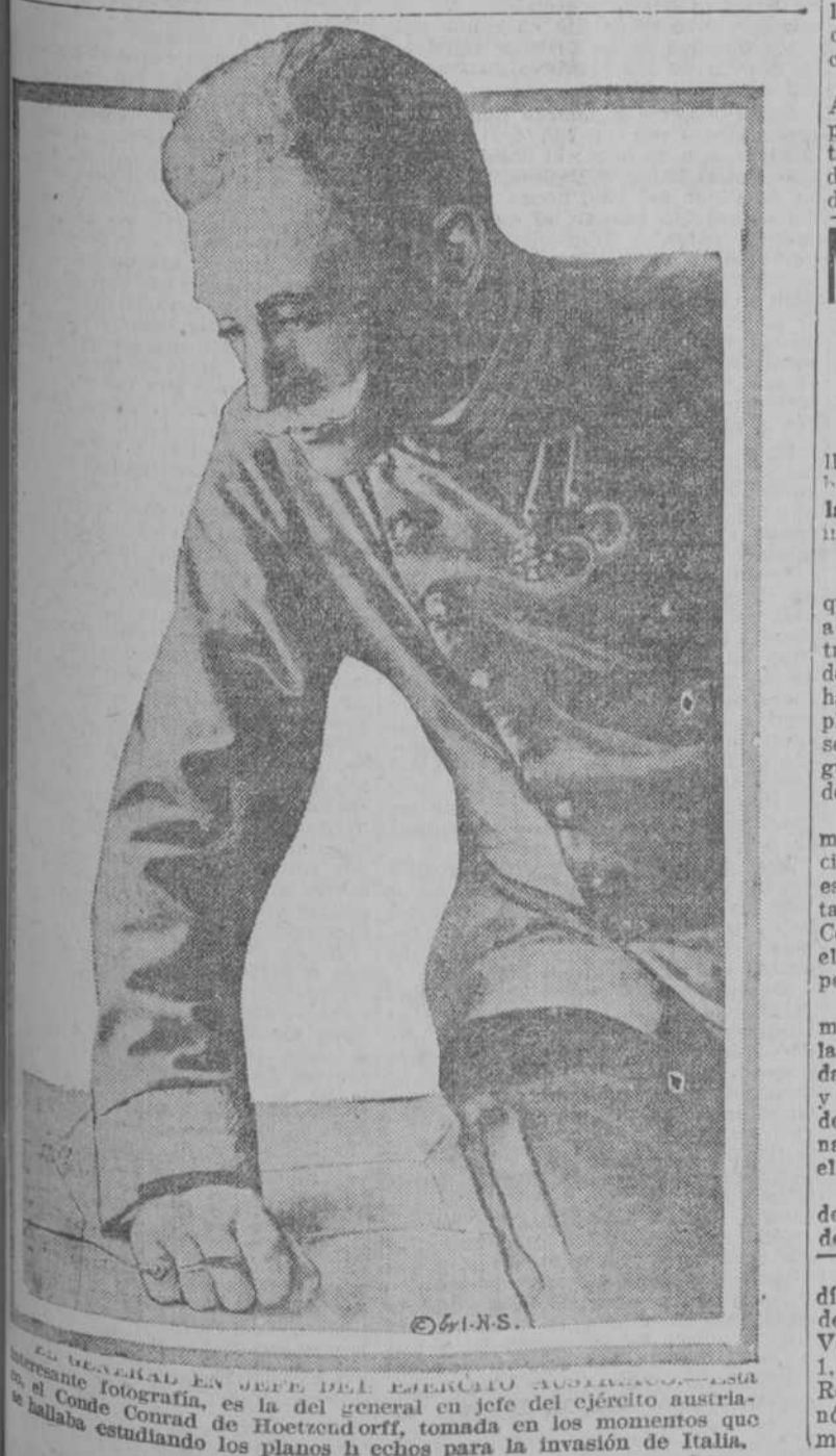
El general en jefe del ejército austriaco, el Conde Conrad de Hotzendorf, tomada en el momento en que se hallaba estudiando los planes hechos para la invasión de Italia.