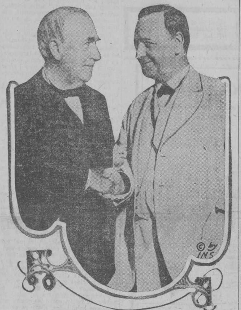
EL FAMOSO INVENTOR EDISON CONFERENCIANDO CON EL SECRETARIO DE MARINA.

En una de ellas cayó un buque español. Es ningún submarino alemán, ni buque de guerra de ninguna clase. Lo único importante que presenciaron en el viaje fue lo siguiente: