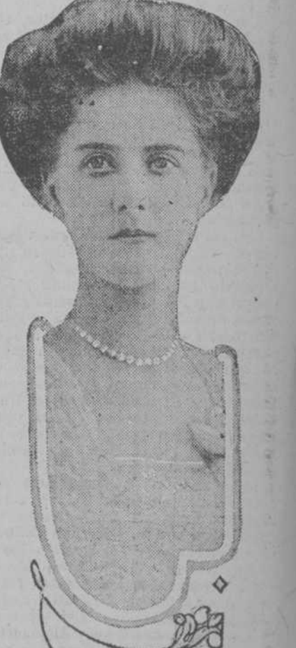
PRINCESS ARTHUR OF CONNAUGHT. UNA PRINCESA REAL INGLESA QUE SE INCORPORA A LA CRUZ ROJA.