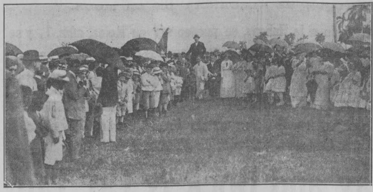
CIENTFUEGOS. Recuerdo fotográfico de la última fiesta escolar.