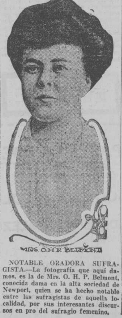
NOTABLE ORADORA SUFRAGISTA.—La fotografía que aquí damos, es la de Mrs. O. H. P. Belmont, conocida dama en la alta sociedad de Newport, quien se ha hecho notable entre las sufragistas de aquella localidad, por sus interesantes discursos en pro del sufragio femenino.