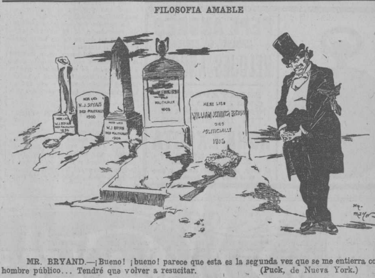
MR. BRYAND.—¡Buena! ¡buena! parece que esta es la segunda vez que se me entierra como hombre público... Tendré que volver a resucitar. (Puck, de Nueva York.)