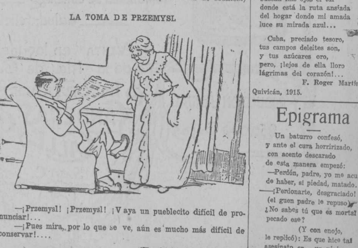
LA TOMA DE PRZEMYSL