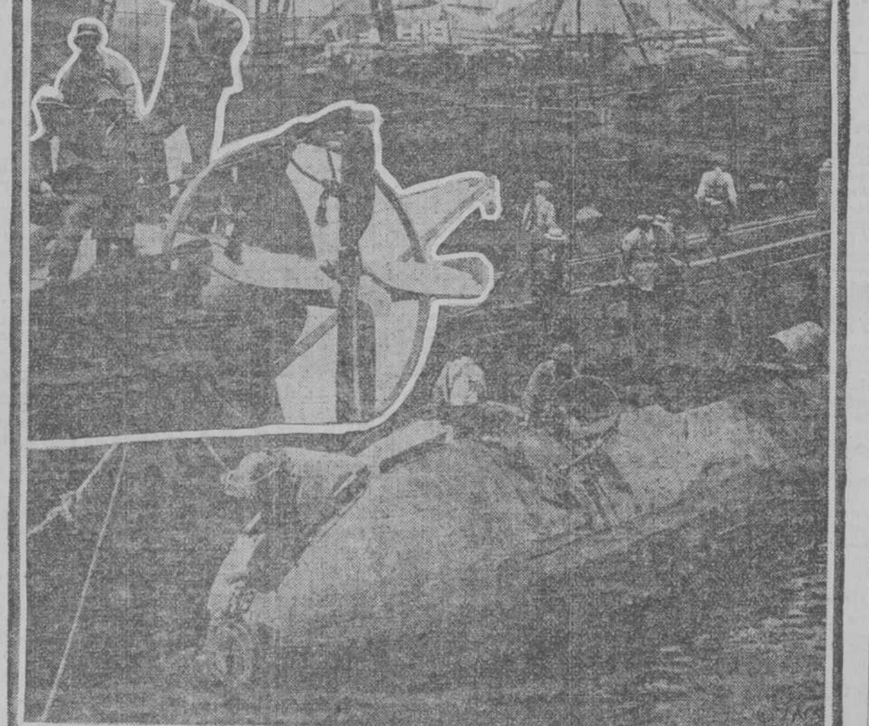
EL PRIMER SUBMARINO INVENTADO.—He aquí el famoso submarino "Holland", que ostenta el nombre de su inventor Mr. Holland, norteamericano, buque que se construyó hace más de veinte años. Holland hizo varias pruebas y luego no pudiendo conseguir el apoyo de su país abandonó la idea, que fué aprovechada por los gobiernos europeos.