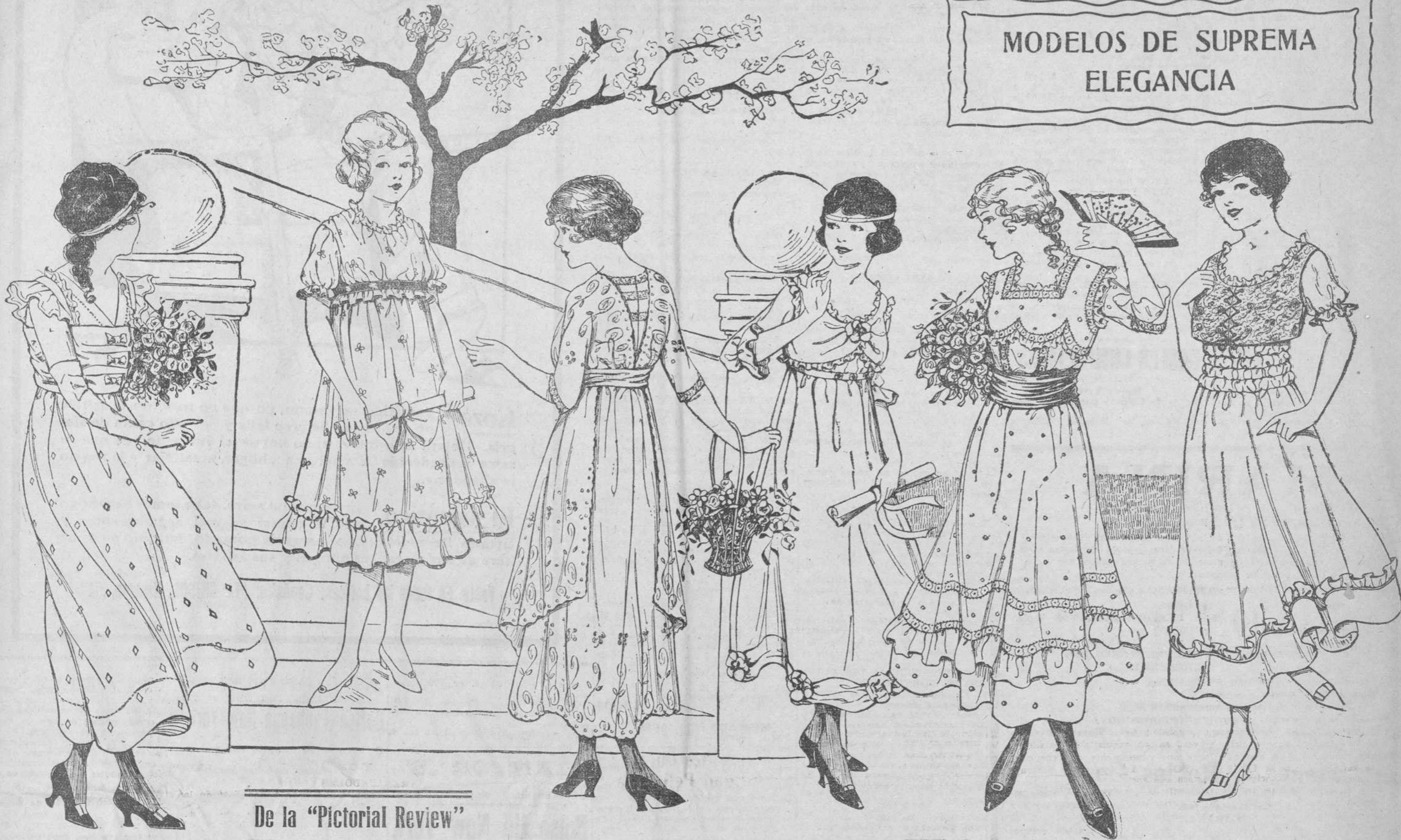
De la "Pictorial Review"

La elegancia sin el lujo es el problema que se les presenta a las mamás par vestir a sus hijas. Obtener la elegancia separada del lujo, es el problema que la Moda ha decidido resolver. La elegancia de la próxima temporada radica en la sencillez, tanto del corte como del adorno, de la tela o telas con que vayan a confeccionar