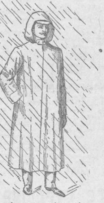
Propios para andar a pie.