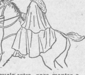
Con vuelo extra, para montar a caballo.