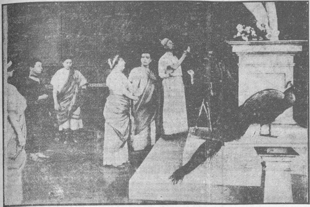
Julio César y Servilia se juraron un amor eterno cumpliendo un rito religioso en el templo de Heros.

La primera película del mundo "JULIO CESAR," tenía que ser exhibida en el primer teatro de Cuba, "EL NACIONAL," por eso Santos y Artigas no han reparado en gastos para darle a la película el realce que merece por su mérito imponderable.