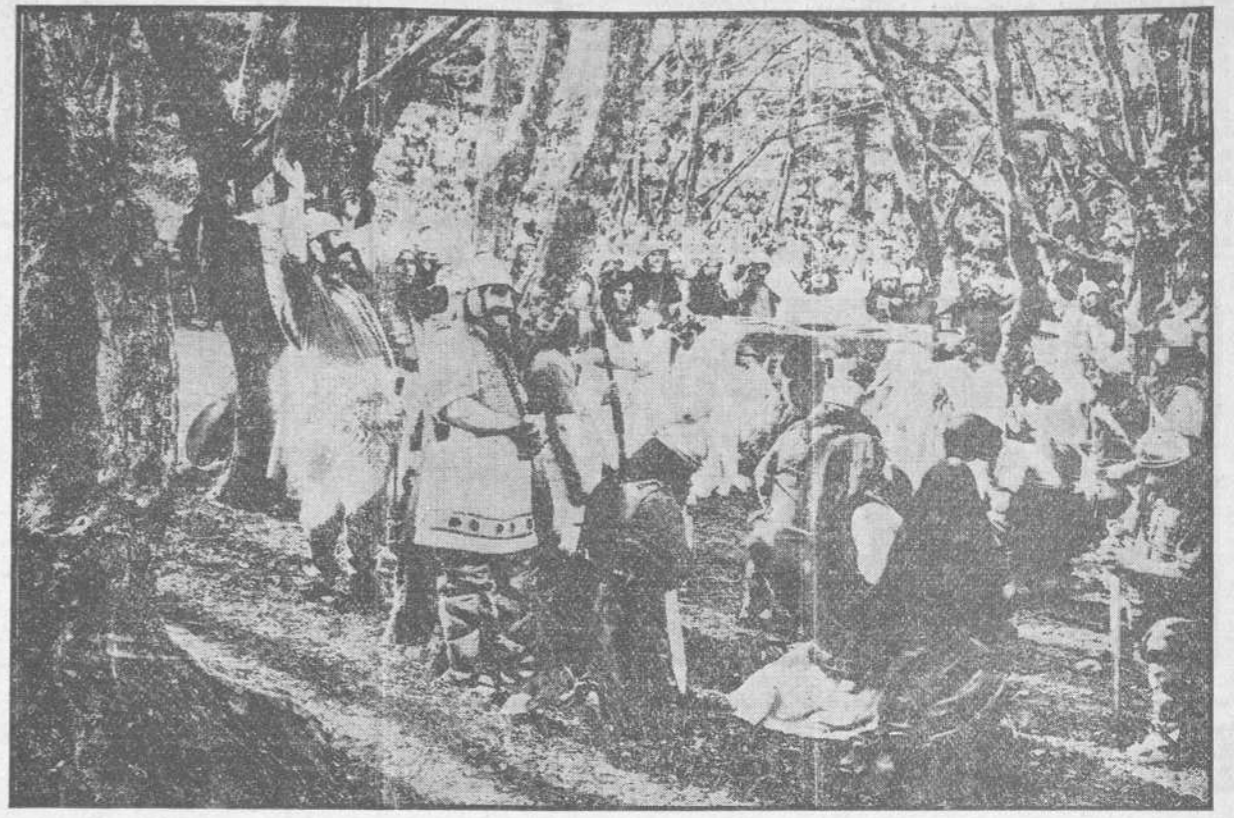
La llegada de Julio César a las Galias contra el invasor levanta el espíritu del pueblo. Los sacerdotes druidas celebran sacrificios.

Las localidades están a la venta en la contaduría del teatro Nacional, y en la Oficina de Santos y Artigas, Manrique 138, será obsequiado quien presente este anuncio con botones y abanicos que tienen escenas de la gran obra "Julio CESAR."