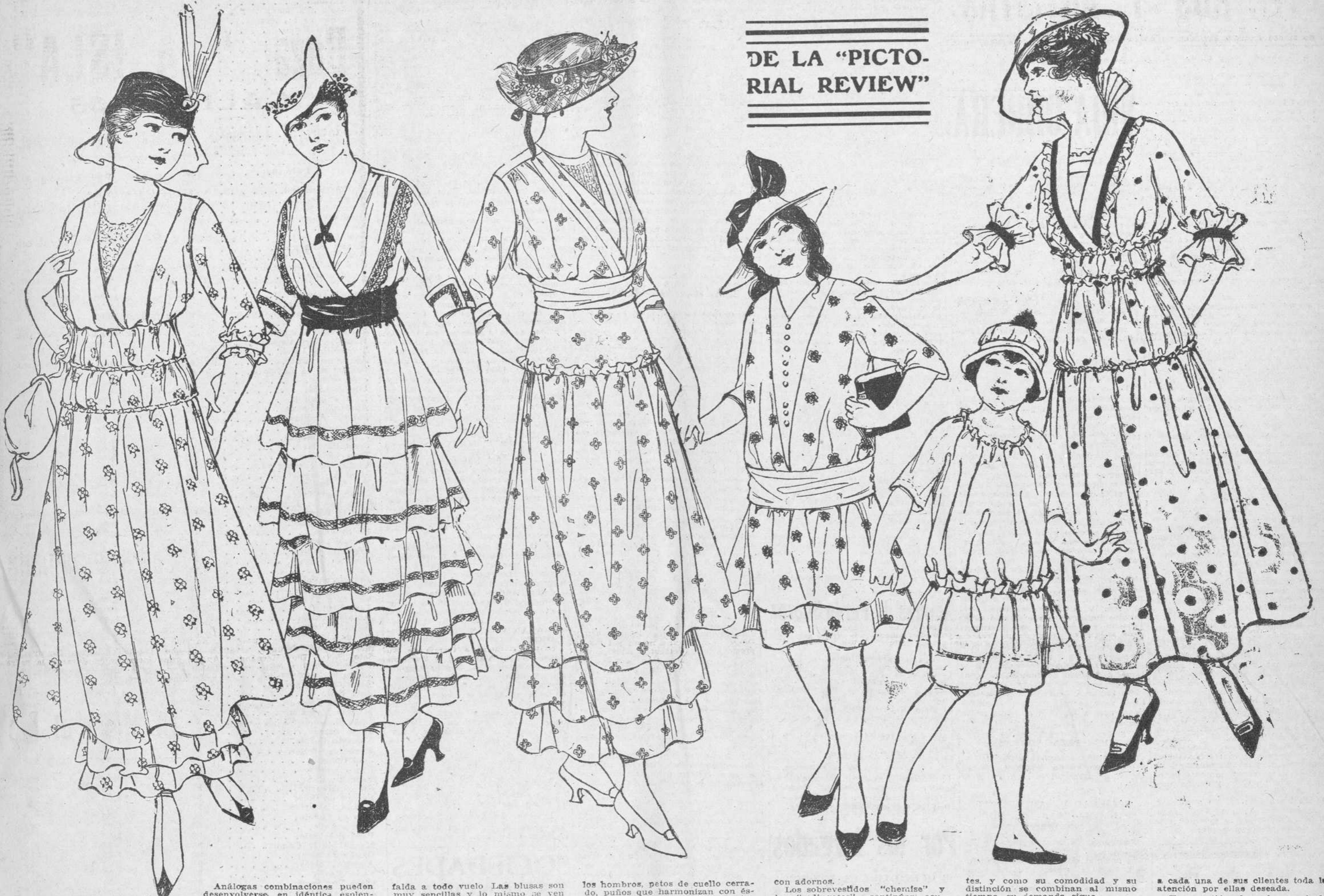
DE LA "PICTORIAL REVIEW"

LA FRASE "Maid in América" goza actualmente de una popularidad y de una aceptación inabundante en su favor. El "Maid in América" es ya una cuestión tan importante, que se ha extendido incluso a la confección de las telas de los vestidos. La moda femenina se ha hecho voluntariamente tributaria del "Maid in América". Caracterízase la actual moda por la presentación de volos exquisitos en los que se introduce una doble o triple combinación de tonos de un mismo color. Una de las creaciones más exquisitas es la de un velo azul faldado sobre el que estampen figuras de un azul oscuro, y se rematan con otro tono aún más oscuro del mismo color azul, en vez de verde que pudiera parecer indicado.