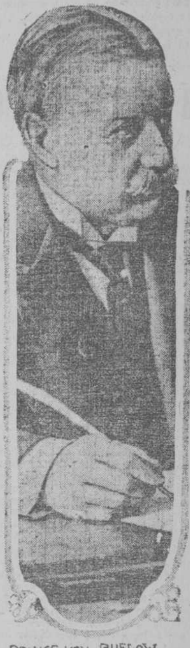
PRINCE VON BUELOW EL EMBAJADOR ALEMÁN EN ITALIA.—Esta fotografía es la del Príncipe von Buelow, quien hasta ahora fué el embajador de Alemania en Italia, y el cual al declararse la guerra entre Italia y Austria ha tenido que pedir su pasaporte. El príncipe von Buelow se dice que es uno de los diplomáticos más astutos del Kaiser.