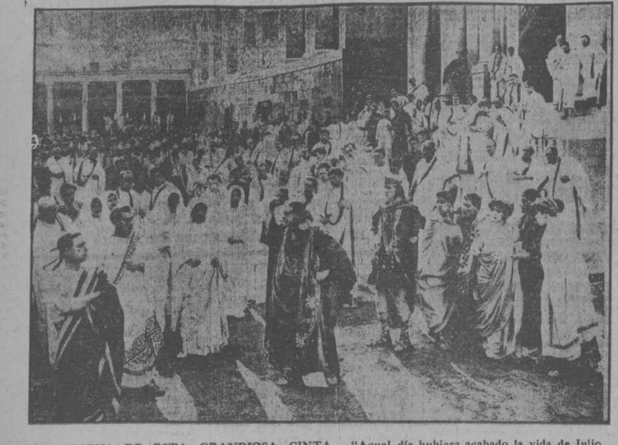
UNA ESCENA DE ESTA GRANDIOSA CINTA. "Aquel día hubiera acabado la vida de Julio César, si la Vestal Virgo Máxima no hubiera interpuesto su influencia con Sila."