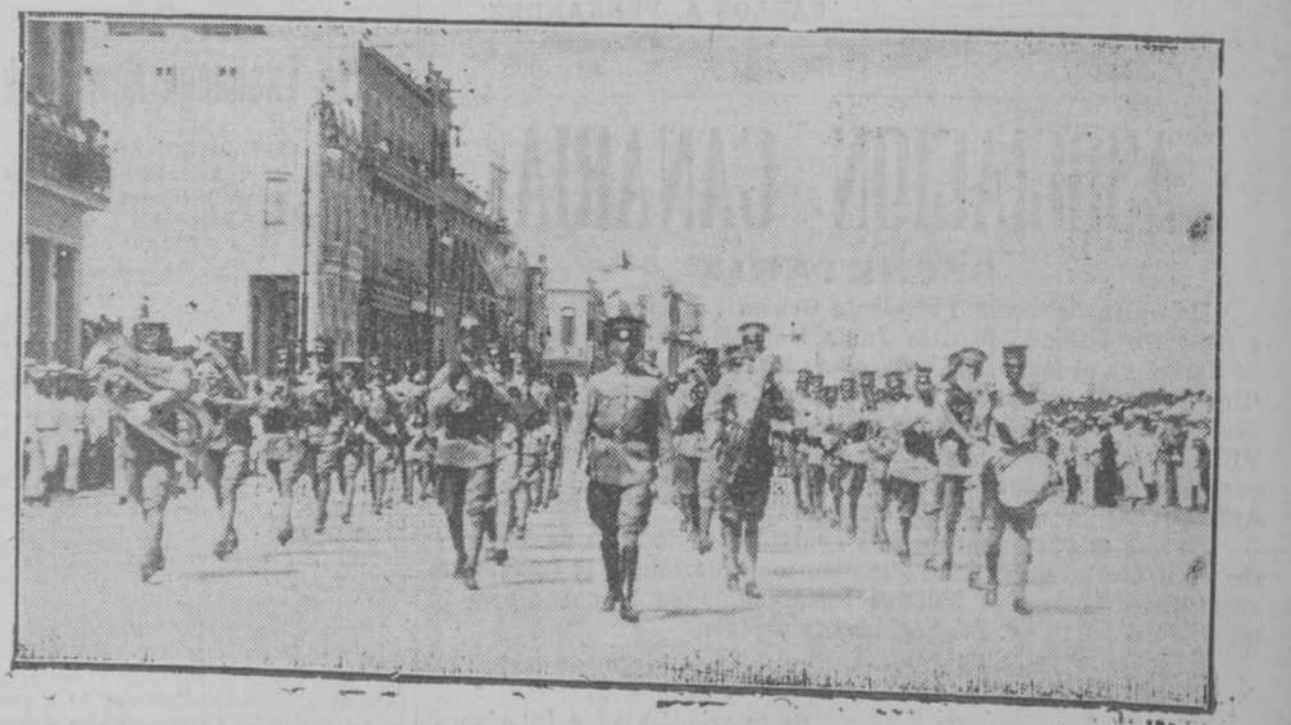
La Banda del Cuartel General desfilando por el Malecón, durante la revista