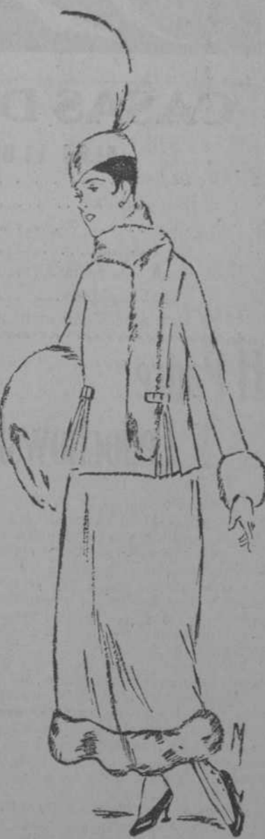
Traje de calle, de serga azul, adornado con "racon."

metáforicamente se entiende, esos mundos, y si ella es fácil, es resultado de la amabilidad en la exposición.