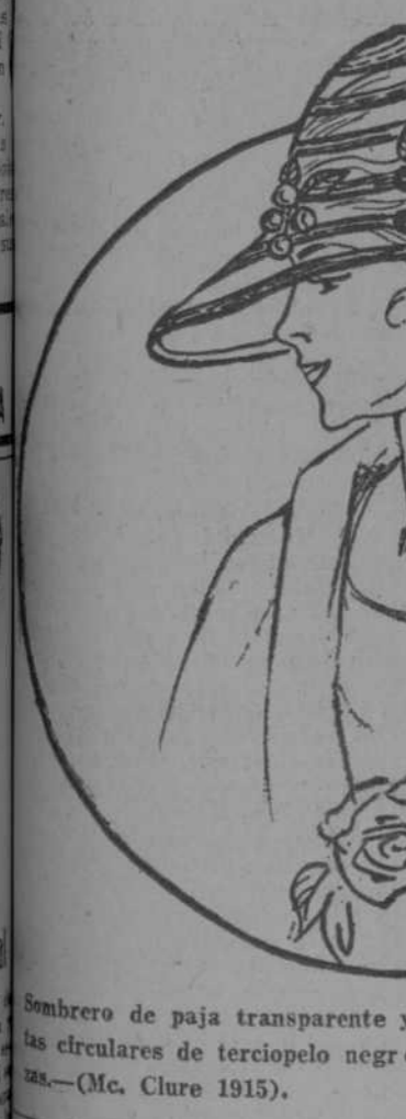
Sombrero de paja transparente y tejida, de color blanco, con cintas circulares de terciopelo negro, estrechas, y "ramos" de cerezas. (Mc. Clure 1915).