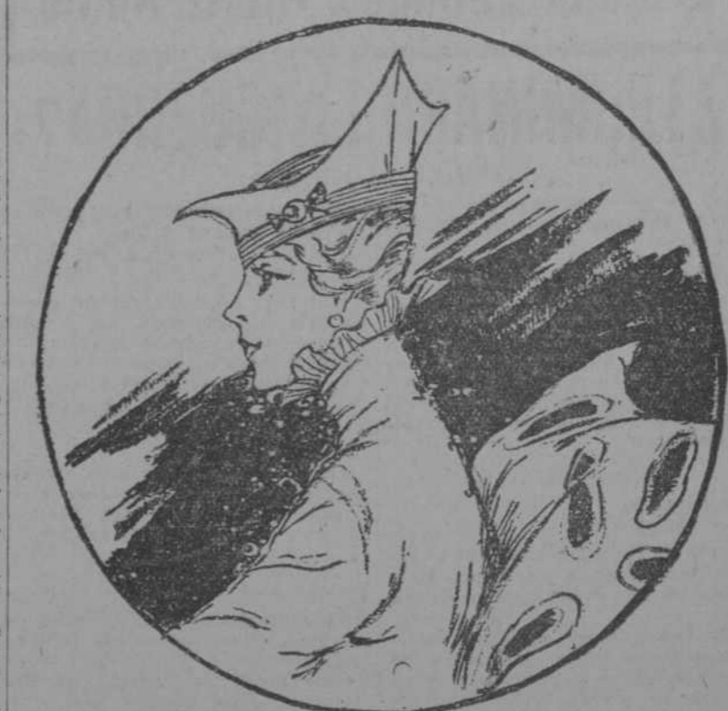
Modelo de Suzanne, de primavera, llamado de 1915. (Mc. Clure)