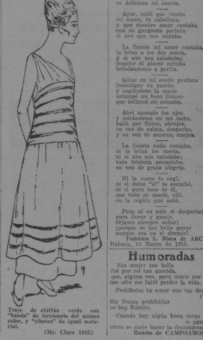
Traje de chiffon verde con "banda" de terciopelo del mismo color, y "ribetes" de igual material. (Mc. Clure 1915)