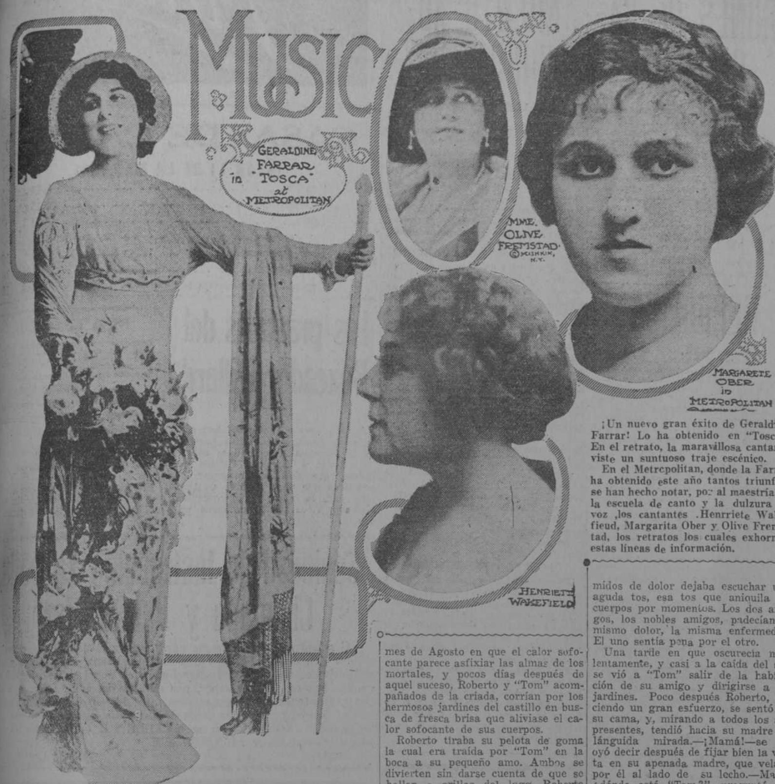
GERALDINE FARRAR en "TOSCA" al METROPOLITAN