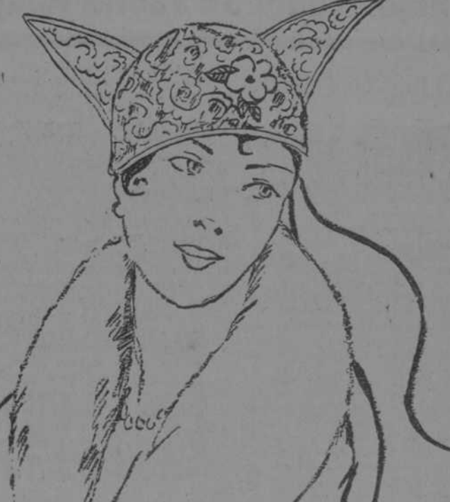
ADORNADO DE TEATRO, BONETE DE PLATA CON ADORNOS DE ROSAS AMARILLAS. (Mc Clare, 1915.)

SOLO POR ESTE MES, y al objeto de dejar espacio para las grandes remesas de mercancías para el próximo verano, de la más alta novedad, que para el mes de Abril recibiremos de los principales mercados de Europa y América, los propietarios de gran establecimiento de tejidos y sedería "El Correo de París", han convenido en rebajar en un CINCUENTA por ciento el valor en venta de todos los artículos. Acabamos de recibir los últimos modelos del corset Warner, propiedad exclusiva de esta casa. Valdés y Pérez. "EL CORREO DE PARIS". Obispo, 80. Teléfono A-3260.