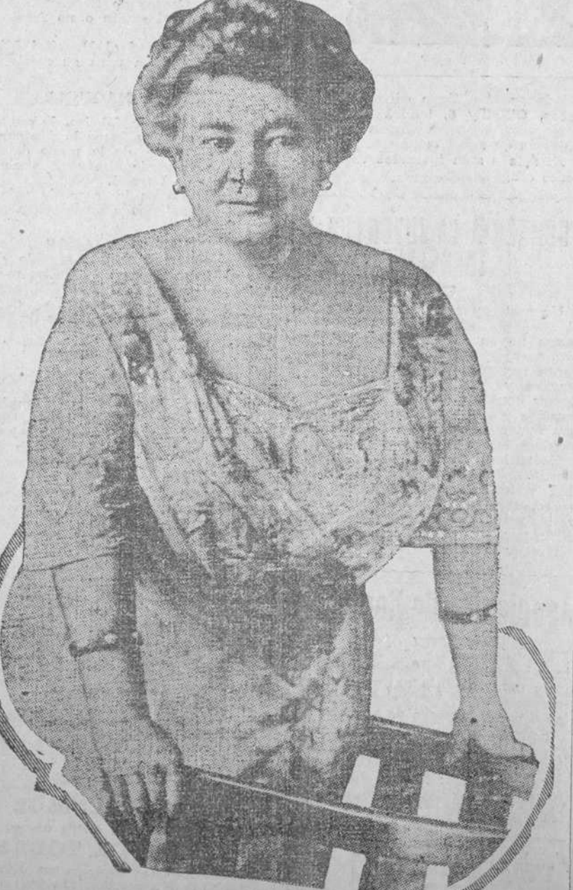
UNA DIVA CON PULMONIA.—Madame Schumann-Heink, la famosa prima-donna que acaba de trasladarse a California, desde New York, por recomendación facultativa, por estar atacada de pulmonia.

Lea el señor Secretario de Obras Públicas