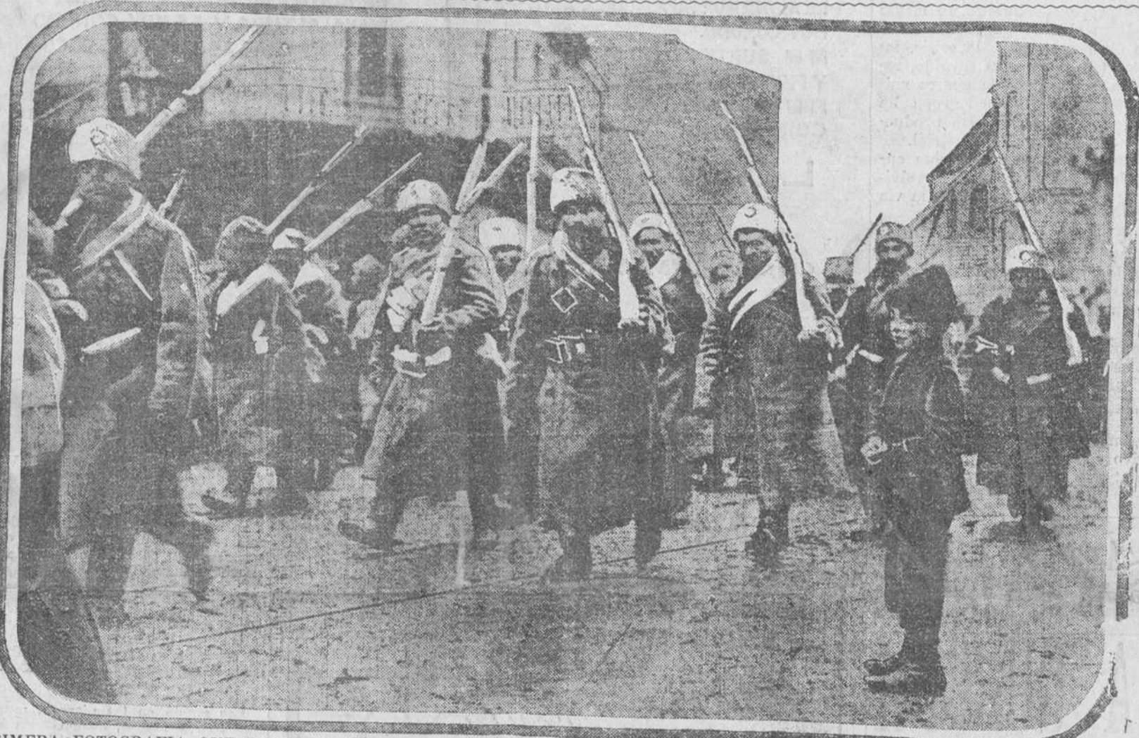
PRIMERA FOTOGRAFIA QUE LLEGA A AMERICA DE LA ENTRADA DE LA VANGUARDIA RUSA DE TROPAS SIBERIANAS EN LA CIUDAD DE LEMBERG.

MAS DETALLES SOBRE EL COMBATE NAVAL DE AYER. REVOLUCION EN PORTUGAL