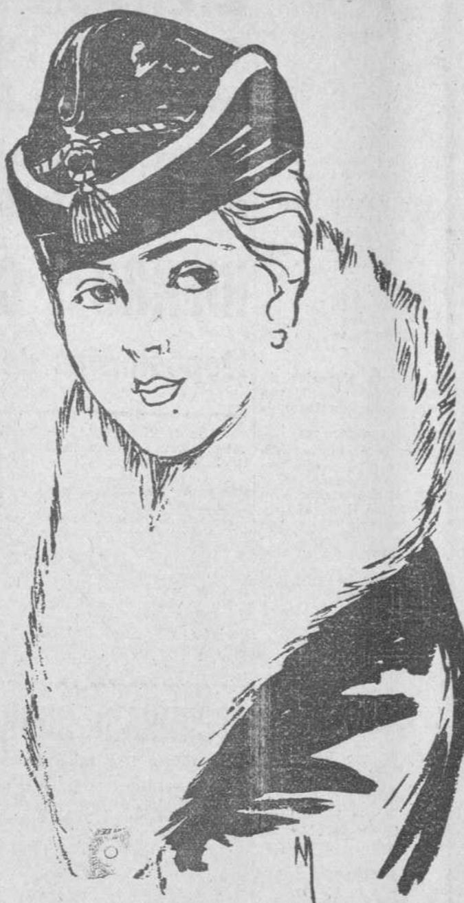
Toca de terciopelo negro. Galón dorado. "Boa" de piel blanca. (Mc. Clure, 1915)