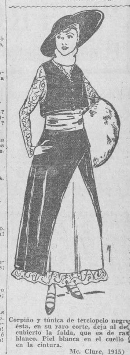
Corpiño y túnica de terciopelo negro. Esta, en su raro corte, deja al descubierto la falda, que es de ray blanco. Piel blanca en el cuello. (Mc. Clure, 1915)

Y con vivas y alegres carcajadas aquellos juveniles corazones aplauden las modernas... salvajadas, cual si fuesen heroicas acciones.