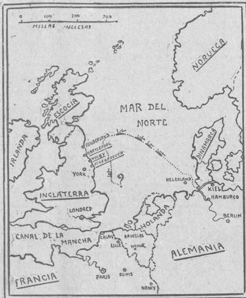
De Hartlepool a la entrada del Canal de Kiel 350 millas inglesas en línea recta.