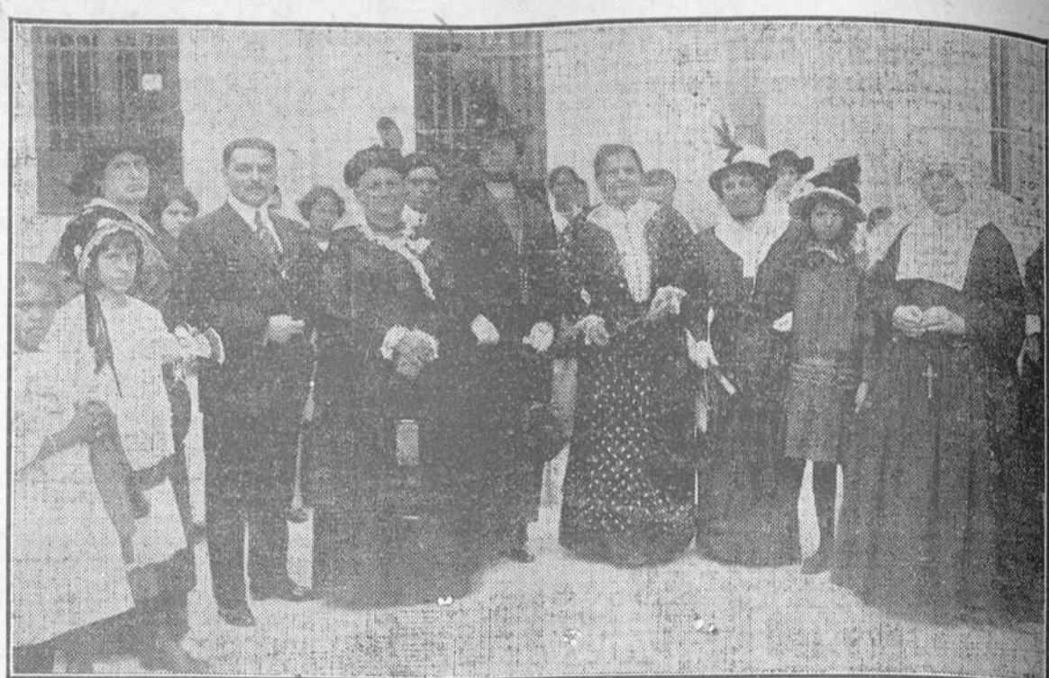
LA REV. M. SUPERIORA, DAMAS DE LA JUNTA Y EL DIRECTOR DE LA BENEFICENCIA EN EL HERMOSISIMO ACTO DE AYER

Desde las doce a las cuatro han sido innumerables las personas que han admirado la labor abnegada de la Dirección, Junta de Damas y las Hijas de San Vicente de Paul. Poco a poco, merced a esta perseverante labor, se va transformando la Casa en un edificio moderno. Han sido reformadas las quinientos cuartos que cuenta para la instrucción y educación de los acogidos, así como los dormitorios y los servicios sanitarios que nada dejan que desear.