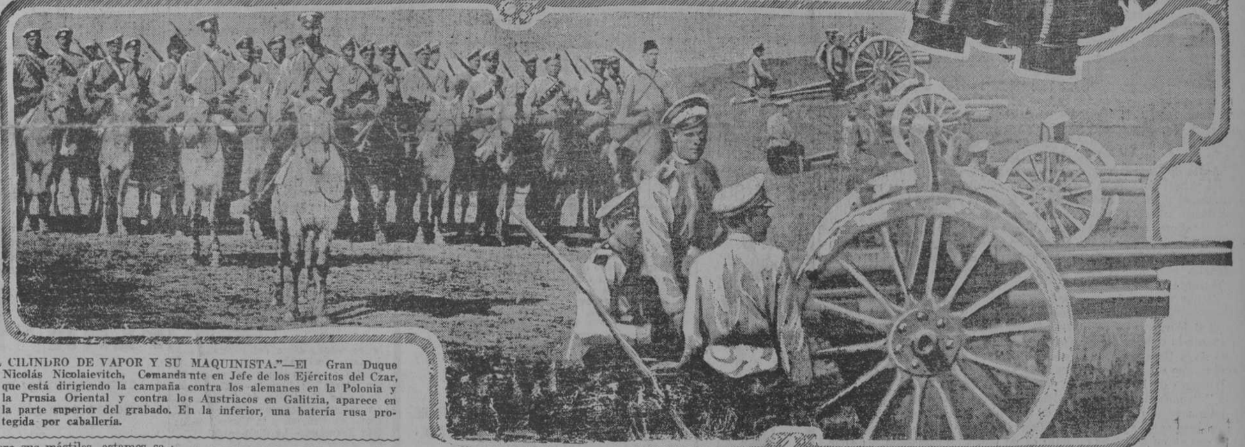
"EL CILINDRO DE VAPOR Y SU MAQUINISTA." —El Gran Duque Nicolás Nicolaiévitch, Comandante en Jefe de los Ejércitos del Czar, que está dirigiendo la campaña contra los alemanes en la Polonia y la Prusia Oriental y contra los Austriacos en Galitzia, aparece en la parte superior del grabado. En la inferior, una batería rusa protegida por caballería.

Después de reproducir esa nota sólo se nos ocurre esta pregunta: ¿si ese cuento bellísimo se realizase, no podría Cuba figurar en él de alguna manera?