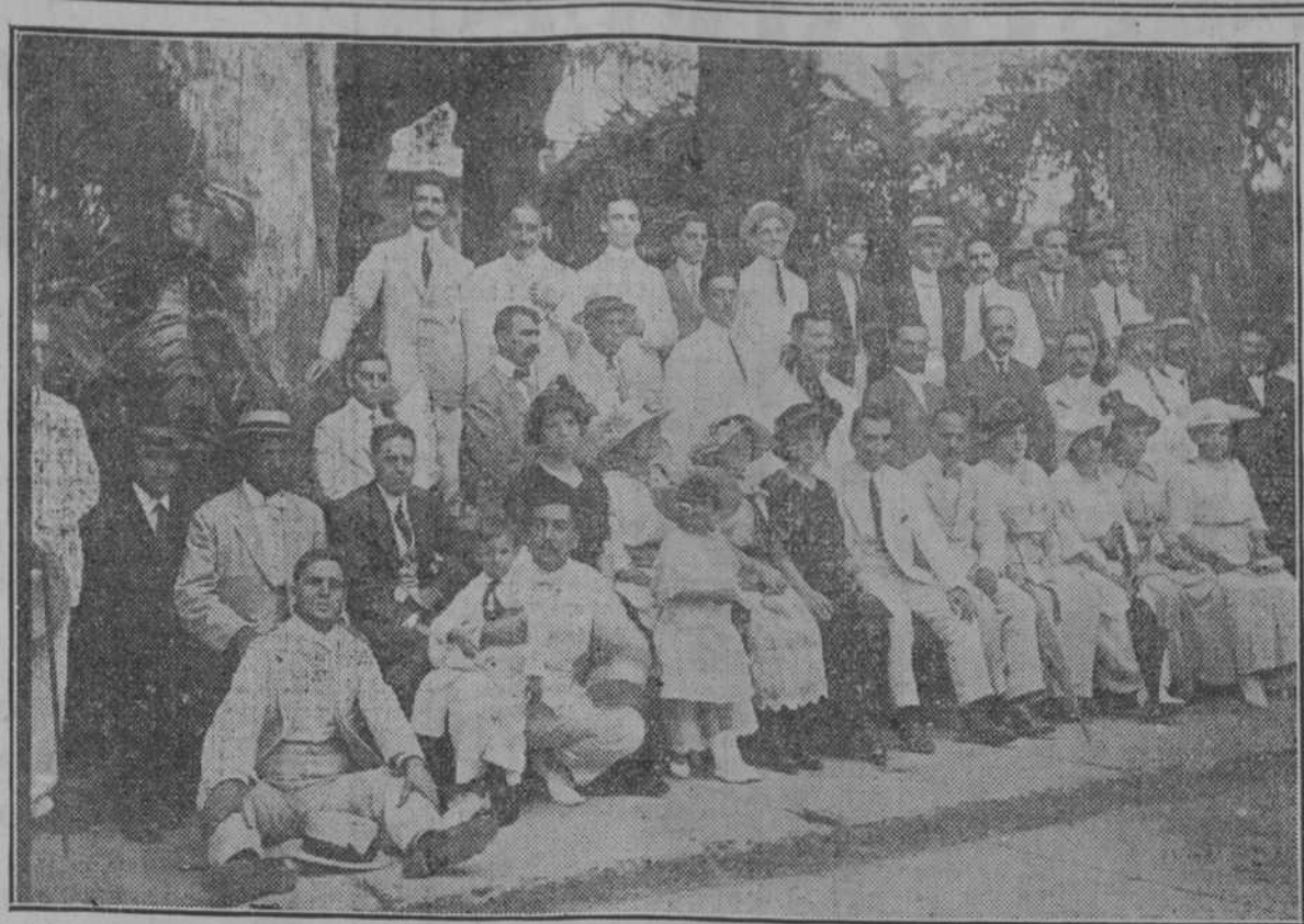
En el salón Ensalada.—Hermoso grupo de la fiesta brillante que ayer celebraron los coronados.

Fotografía de Kalo. Véase la información en la plana 5.