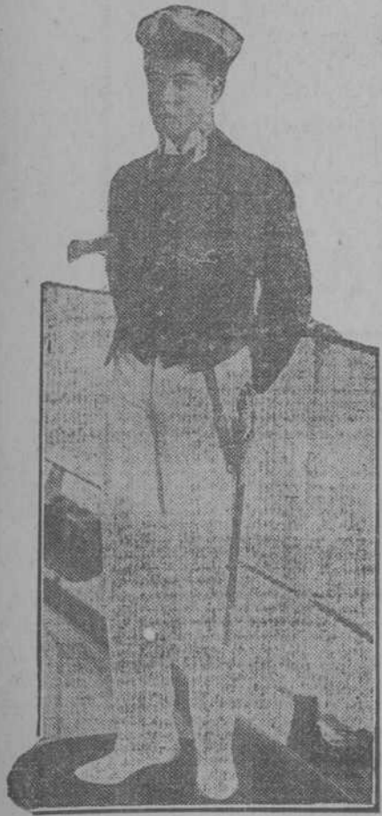
El Príncipe de Gales, heredero del trono de Inglaterra, que se ha unido a las tropas expedicionarias del Ejército.