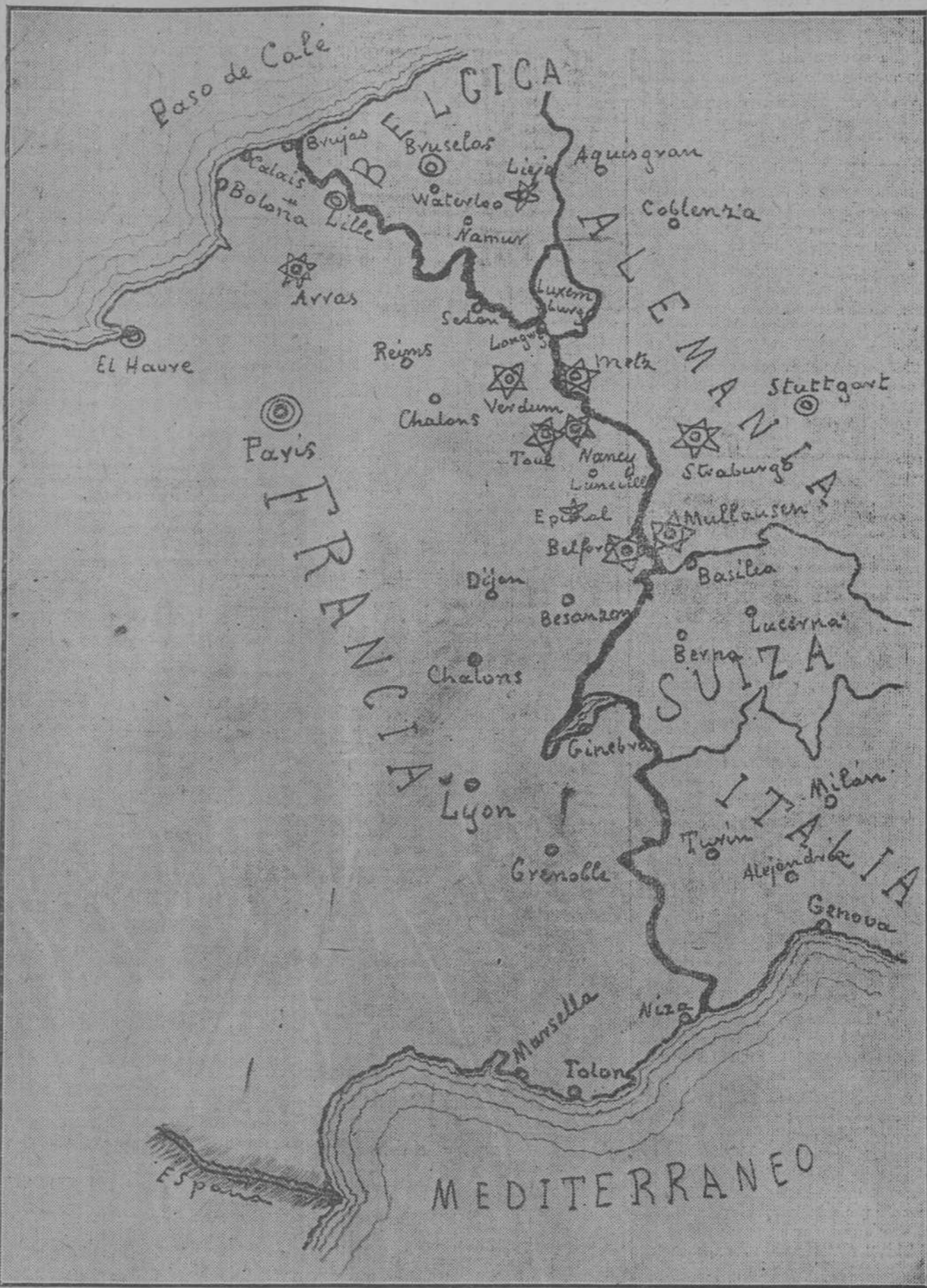
Mapa de la frontera oriental de Francia, en sus límites con Bélgica, Alemania, Suiza e Italia. Las estrellas representan puntos fortificados. En el mapa se ve la zona francesa que linda con Alemania, representada un extenso campo atrincherado con Verdun, Toul, Nancy, Lunéville, Epinal y Belfort.