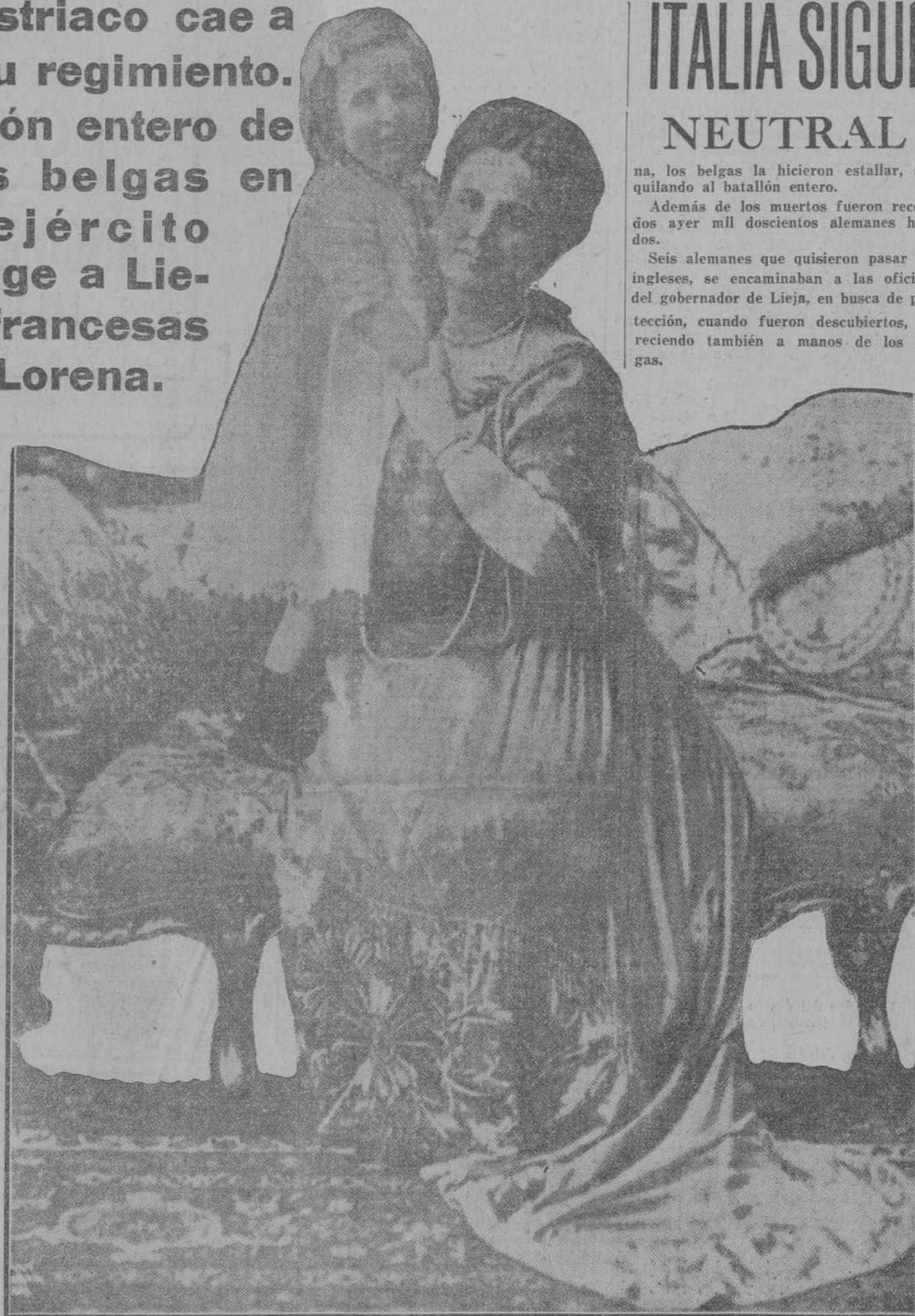
La Reina Guillermina de Holanda y su única hija, la Princesa Juliana.

Al cruzar los invasores la zona minada fueron rechazados, y al hallarse precisamente los alemanes sobre la mi-