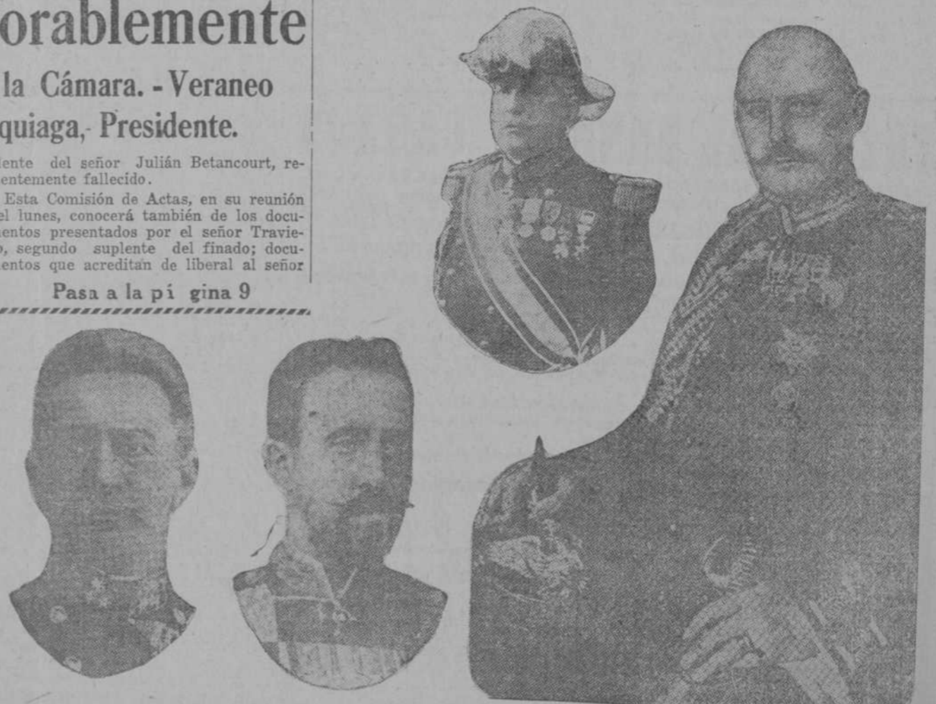
1. General Conrad Von Hoetzendorff, General en Jefe del Estado Mayor del Ejército austriaco. 2. Gran Duque Nicolás Nicolaewitch, Generalísimo del Ejército ruso. 3. General Joffre, Generalísimo del Ejército francés. 4. General Helmut Von Moltke, Generalísimo del Ejército alemán.