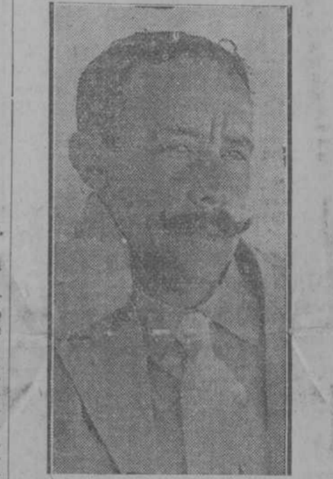
EL DIA GRAFICO.—General Joaquín Maas, del ejército mejicano, que llegó ayer en el "Espagne" y continúa viaje a Europa.