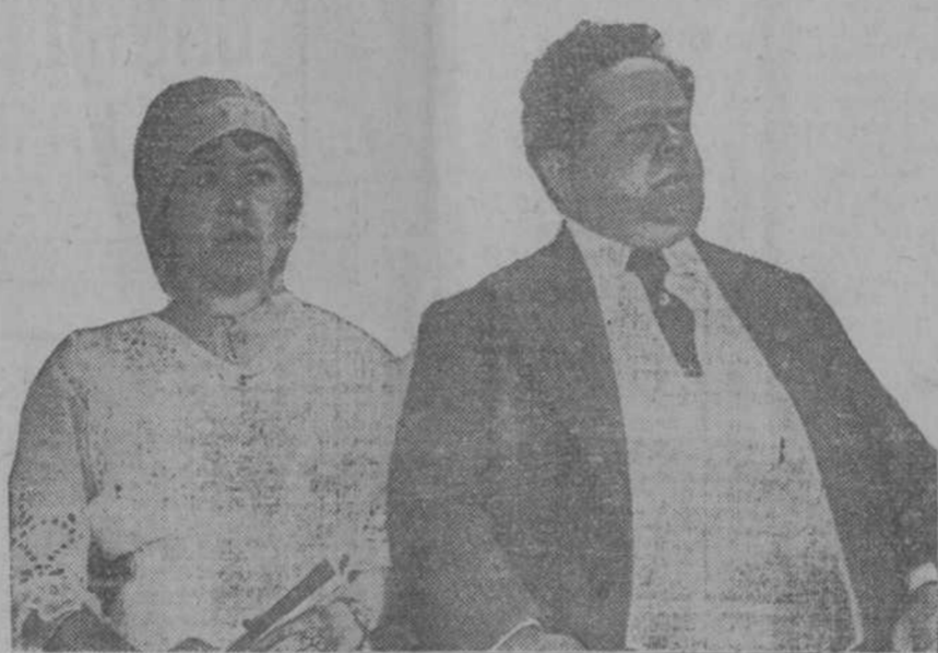
EL DIA GRAFICO.—El ex-ministro mejicano Ledo. Querido Moheno y su distinguida esposa que llegaron ayer de Méjico y continuarán hoy viaje a los E. U.

Cuando el vapor "Espagne", llegado ayer al medio día de Veracruz, fué puesto a libre plática, pasamos a su bordo. El primer pasajero de este hermoso buque con quien procuramos entrevistarnos, consiguiéndolo, fué el Ledo. Querido Moheno, que sabemos ya venía en él, con su familia. Como es notorio, el señor Moheno acaba de renunciar su cartera de Ministro de Relaciones Exteriores del Gobierno del general Huerta y ha sido una de las figuras más prominentes en la política mejicana desde la caída y muerte del Presidente Francisco Madero hasta la actualidad. Por el cable sabemos que el señor Moheno, al embarcarse en Veracruz, había hecho importantes declaraciones, publicadas oportunamente en el DIARIO DE LA MARINA. Ahora se trataba de ampliar esas declaraciones, y conseguir otras nuevas, de mayor interés aún. El reportero así pudo conseguirlo, tomándole textualmente de labios del mismo ex Ministro. Este es una cultísima y atenta persona, que nos recibió con la mayor amabilidad. Sus declaraciones revisten una verdadera e importantísima trascendencia.