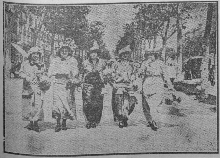
La fiesta de la Flor en Barcelona.—Señoritas vendedoras de flores en el Paseo de Gracia.