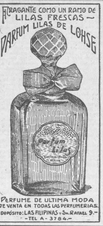
PERFUME DE ULTIMA MODA DE VENTA EN TODAS LAS PERFUMERIAS. DEPOSITO: LAS FILIPINAS - S. RAFAEL 9. - TEL A-3784 -

Besar un rostro teñido con arrebol perfumado del doctor Fruján, es goce que se envía cuando se conoce. La ternura de la piel, su rosado claro, suave y transparente y su fragancia exquisita, hace al beso más delicioso que de suyo es esa efusión cariñosa. El doctor Fruján, perfuma su arrebol que tiñe graciosamente de rosado y tonifica y sana el cutis, evitándole afecciones.