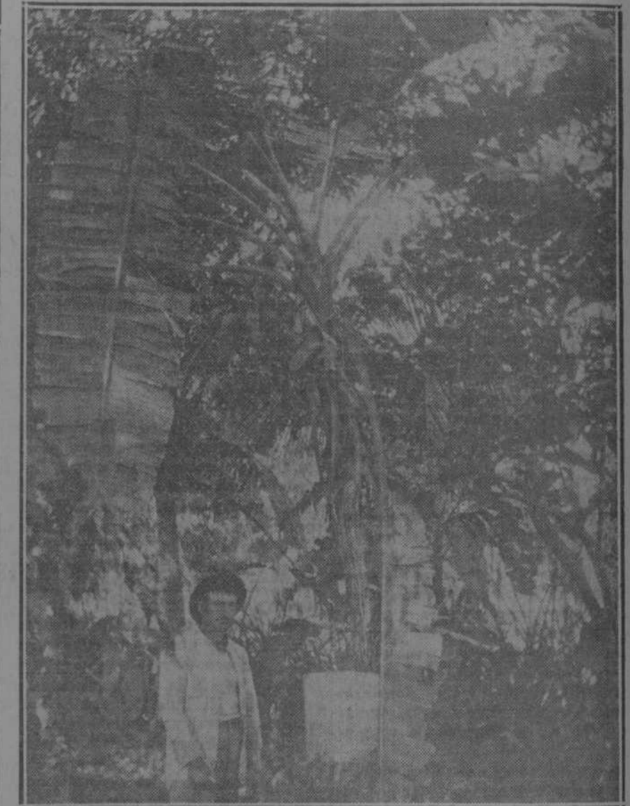
Mata de plátano enferma, tratada en una finca de Wajay.