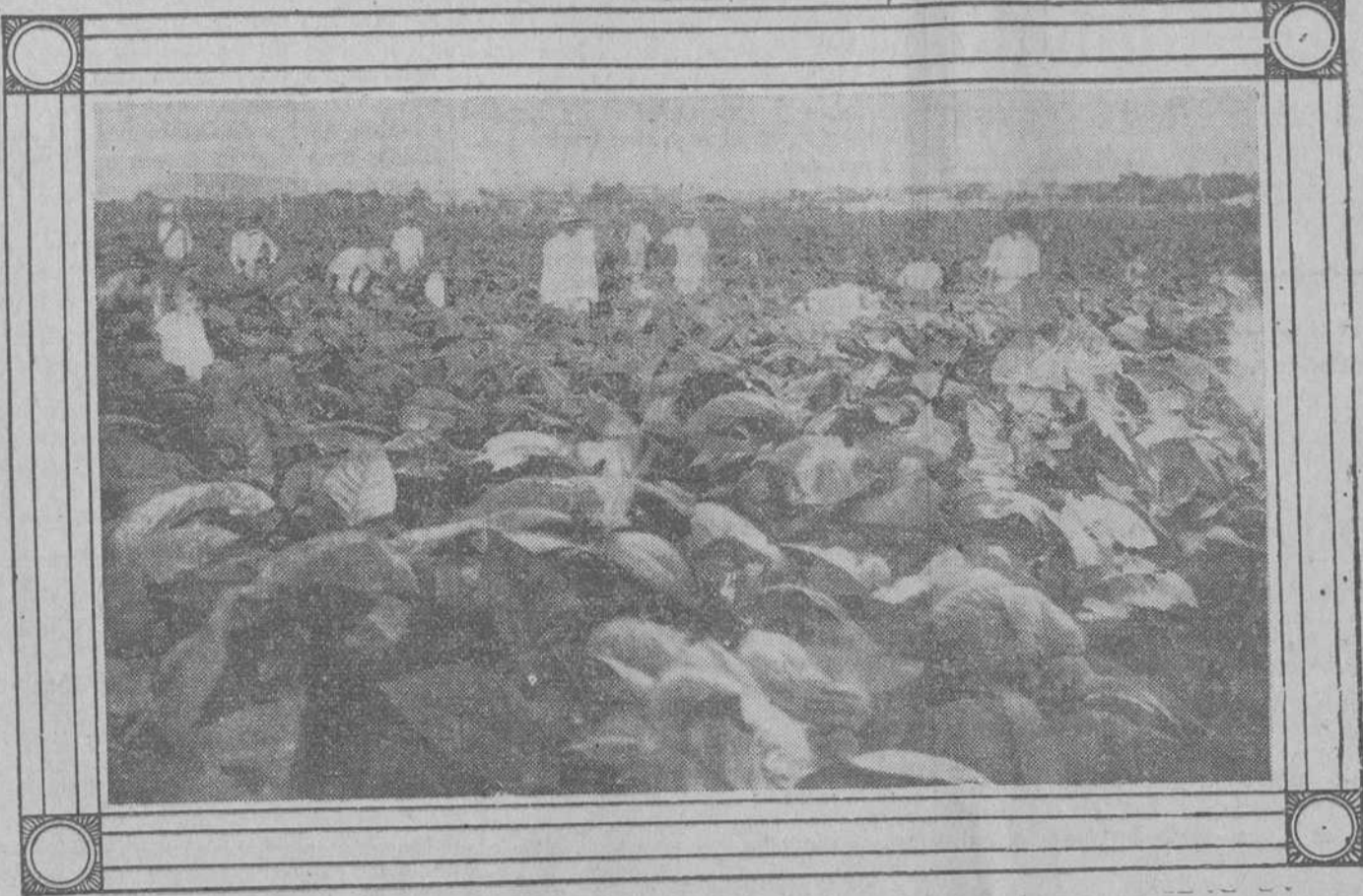
GUANAJAY.—Vega de 400.000 matas de Nicasio Lorenzo. Finca El Alambique.