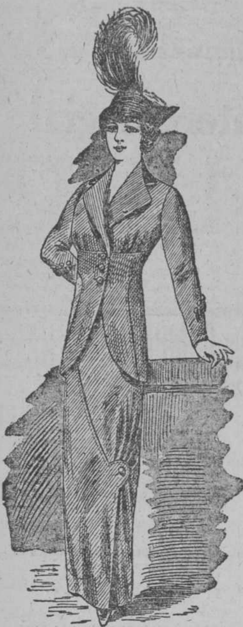
Trajea Sastre "Gabardine" lana cuello y botones de terciopelo, colores moda. Chaqueta forrada select.

Lo que ha de ser nota elegante en nuestras damas son los trajes y abrigos de nuestras damas, comprados en