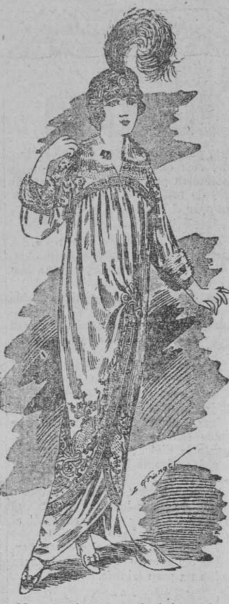
Manteau chic con satén de lana, adorno bordado a mano, y guarnecido de piel petit gris, colores nuevos, forrado todo seda.

No olviden las damas los Patrones Standard para hacer sus trajes, ni tampoco la exquisita ropa blanca de venta en estos almacenes.