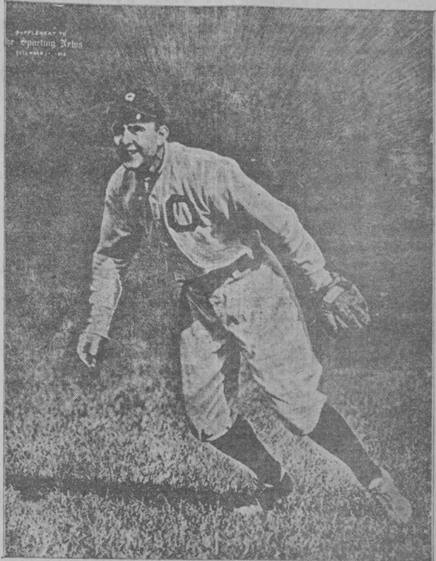
Manager y Centedfielder del "Cleveland" de la Liga Americana