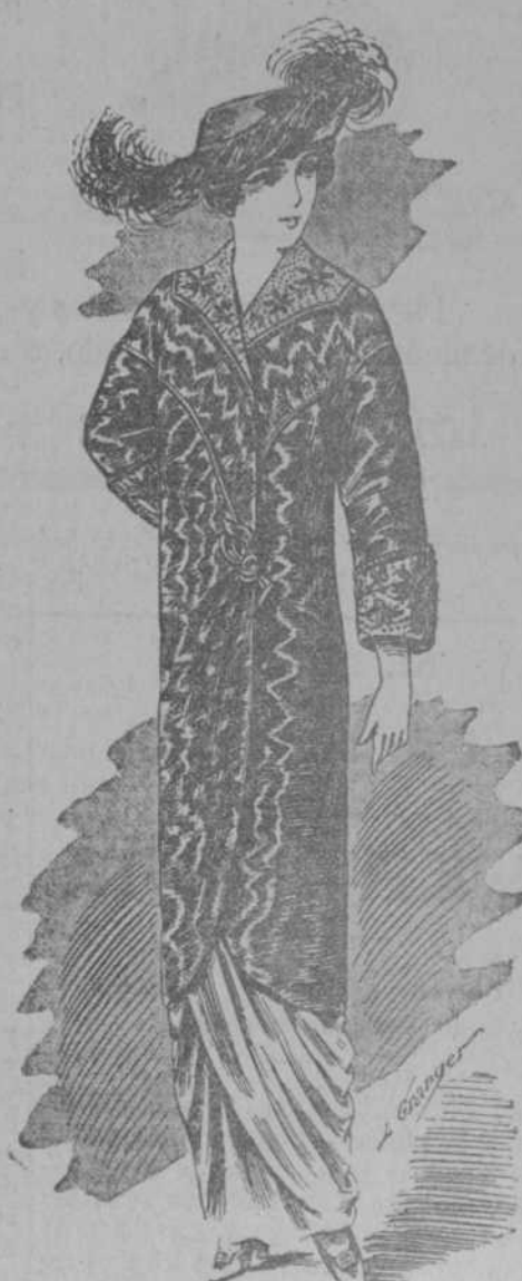
Traje Sastre COTE CHEVAL, cuello y boca manga terciopelo bordado, colores moda. Chaqueta forrada seda.