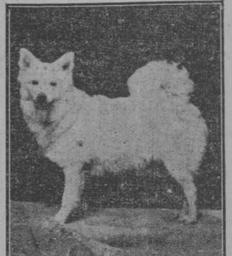
Esta hermosa perra raza Spich, pura, premiada en las Exposiciones Caninas de Londres, Madrid y Habana, ha dado a luz seis hermosos perros finísimos: los únicos que hay en la Habana. Se venden, y las personas de gusto pueden enterarse del precio pasando por el Bazar París, Zuluetta y Neptuno (Manzana de Gómez) en donde informarán.

Un comisionista, al que se le había extraviado un estuche de cuchillas de muestras, viajando en la guagua que va del Central "Francisco" al parador "Canario" del F. C. de Cuba, dió parte del caso al comandante Jefe de la Rural de Camagüey. Dicho Jefe dió las órdenes oportunas al Jefe del Destacamento del Central "Francisco," y a poco era entregado el estuche con las cuchillas a su dueño. Anteriormente se habían hecho gestiones cerca del guaguero sin resultado alguno. Un aplauso merece la Rural por su actividad.