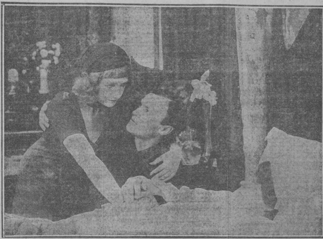
Debe usted separar con tiempo su localidad para esta velada de moda que será muy animada.

Al día siguiente Isabel y Rafael salvaron la distancia a la vieja mansión. Al llegar al parque, Isabel, modesta, tímida, no se atrevía a continuar. Rafael la tomó de la mano y la condujo a la habitación de su madre gravemente enferma. Isabel y Rafael comprendieron que la noble anciana no tardaría en seguir al Barón... Su respiración salía con pena de sus labios y sus ojos, aquellos ojos todo bondad se hallaban fijos y ardientes. Su último esfuerzo fué para bendecir a Rafael. Y murió tranquila la noble anciana, al ver, al fin, a aquel ser todo abnegación y sacrificios, feliz en brazos de la encantadora hija del guarda-faros.