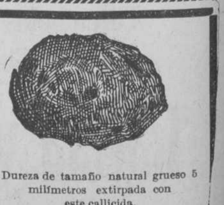
Dureza de tamaño natural grueso 5 milímetros extirpada con este callicida.