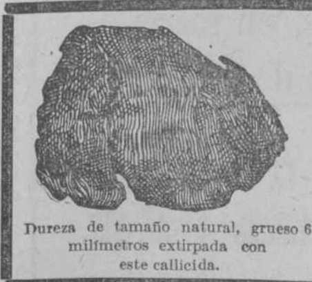
Dureza de tamaño natural, grueso 6 milímetros extirpada con este callicida.