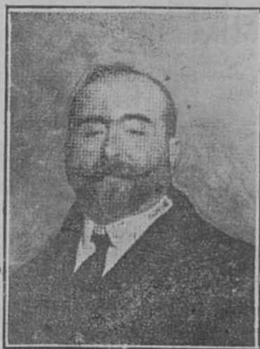
DON JUAN DE LA CIERVA

Vayamos ahora con don Juan de la Cierva. ¿Se puede hablar de don Juan de la Cierva? Pido mil perdones por ello; contritamente ruego que se me perdone mi extravío. La Cierva ha sido el más leal secundador de la política de Maura; desde el Ministerio de la Gobernación realizó una extensa y fecunda labor. Cierva es hombre recio, fuerte, incansable; tiene una frente ancha y unos ojos escrutadores, intuitivos. El rasgo principal de su carácter es comprensión rápida de las cosas. Existen políticos inteligentes, pero que no aciertan a ver los enredos y meandros de la vida parlamentaria. Cierva conoce perfectamente los hombres que actúan en la política y sus trazas, arbitrios, maneras y zalagardas de esos hombres. No tiene nada de incauto; a muchas semanas y aun meses de fecha prevé las incidencias de la política. No hay mayor trabajador que él; levántase apenas amanecido; labora durante todo el día; hurta bastantes horas a la noche para el estudio de los asuntos en que entiendo. De qué manera es posible trabajar tanto, tan fecundamente, con tanta insistencia! Como orador, Cierva está reputado como el más temible polemista parlamentario; es lento, cauto, sereno, incisivo. Cuando habla no se puede desdénar ninguna de sus frases; todas están reflexionadas, meditadas. Sus alusiones van como calladas saetas a herir al adversario.