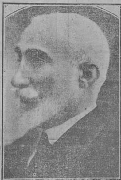
DON ANTONIO MAURA

Tracemos—brevemente—la etopeya de las principales figuras políticas de España. Comienza a agitarse el mundillo político nuestro; para dentro de poco se anuncian sensacionales acontecimientos; oportuno nos parece esbozar unos leves retratos. No damos igual importancia—como verá el lector—a todos los personajes que retratamos. Será duro nuestro juicio (por imparcial lo tenemos) pero es éste: En España, entre la turba de ex ministros, parlamentarios, oradores, políticos de todos pelajes, sólo hay un número contadísimo de hombres. Llamamos hombres a espíritus rectos, nobles, leales, enérgicos, perseverantes, intuitivos, inteligentes, patriotas.