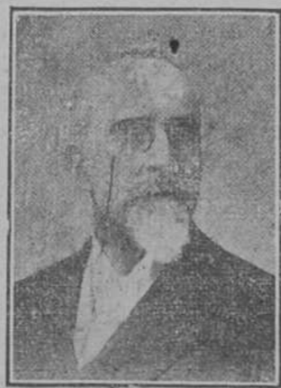
DON GUMERSINDO AZCARATE

La primavera pasada, en el último discurso que el señor Lerroux pronunció en el Congreso, dijo lo siguiente: "En España no hay más que dos hombres; esos dos hombres son Maura y Azcárate." Lerroux al hablar así no expresó completamente su verdadero pensamiento. Citó a Azcárate como uno de los dos únicos hombres que hay en España; Azcárate, discreto, laborioso y culto, no es una figura eminente. Lerroux lo citó por no citarse a sí mismo. El verdadero pensamiento