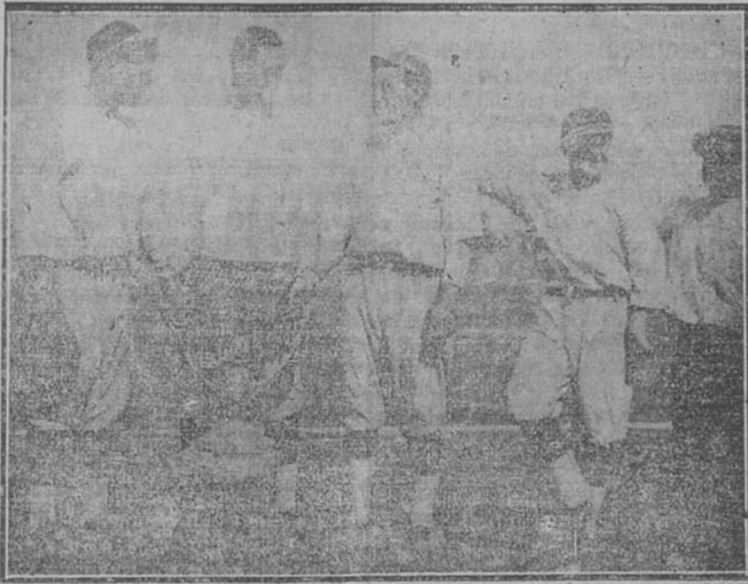
Walter Johnson, el champion pitcher de 1913, rodeado por miembros del club "Detroit." Sobre el suelo está la copa ofrecida a Johnson por los fanáticos de la ciudad Capitolina.

Si nos detenemos a establecer comparaciones entre los dos teams, no tardaremos en convencernos de que los Albos Paquidermos son infinitamente más fuertes que sus ilustres rivales. En el infield, sobre todo, la superioridad del club de Connie Mack es tan evidente, tan marcada, tan conclusiva, que ni aun los más intrasigentes fanáticos neoyorkinos se atreven a discutir el punto. Individualmente comparados los ocho infielders, no es posible dudar que Mc Innes, como iniciador, vale un millón de veces más que Merkle; que Eddie Collins se mete a Larry Doyle en el bolsillo de los foros; que Barry, en el short, vale más que todos los infielders neoyorkinos juntos, y que Baker es hoy superior a Herzog y archisuperior a Shaffer.