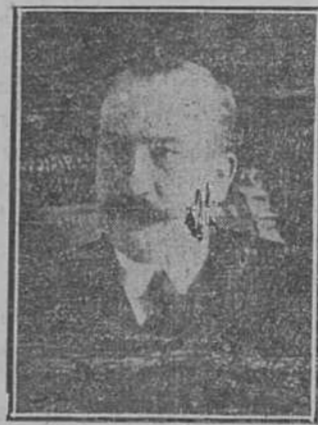
DON ALEJANDRO LERROUX

rosa dialéctica; sabe ser conciso, rotundo y enérgico. Salido de la nada, este conductor de muchedumbres des-