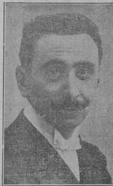
DON MELQUIADES ALVAREZ