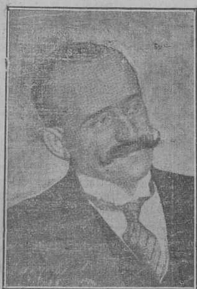
CONDE DE ROMANONES

mo el jefe del Partido. Cosa es esta de la jefatura del partido liberal que habrá de ventilarse en la oposición. El Conde de Romanones posee una de las más cuantiosas fortunas de España; tiene una faz vulpina; en su cara, destaca la nariz aguda, agresiva, colorada en su extremo. Gusta llevar el conde