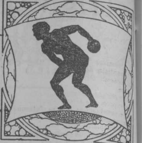
Por Ramón S. de Mendoza