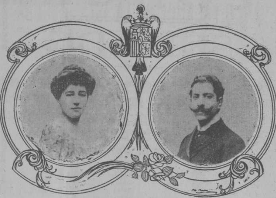
El nuevo Ministro y su esposa.

En el vapor alemán "Ypiranga," que se espera en este puerto el jueves próximo, llegará acompañado de su distinguida esposa, el señor don Alfredo de Mariátegui y Carratalá, nuevo Enviado Extraordinario y Ministro Plenipotenciario de España en Cuba.