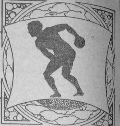
Por Ramón S. de Mendoza