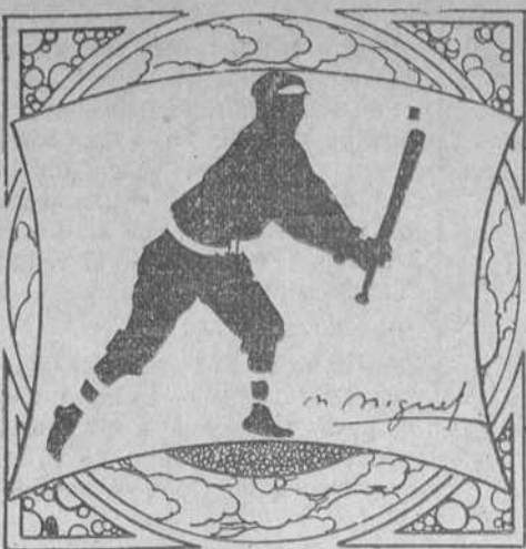
Por M. L. de Linares