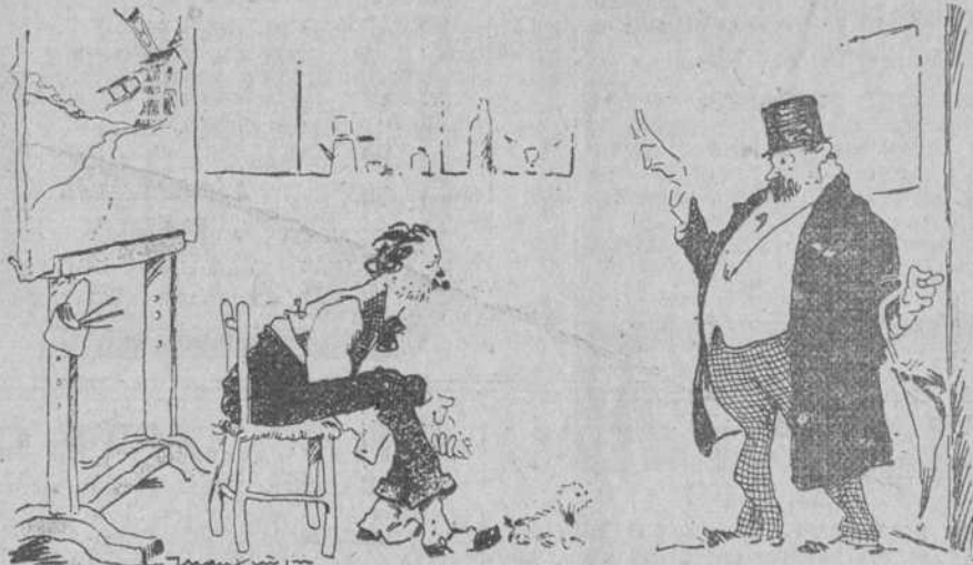
—Es la última vez que vengo a cobrarle a usted el alquiler. —Hombre, me alegro, porque la insistencia de usted ya empezaba a fastidiarme! (Rire, de París.)