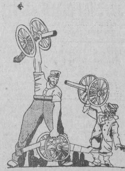
—Continuaré hasta que te des por vencido. (Lustige Blatter, de Berlín.)

La contemplación de Toledo desde estas lomas? Si; volvamos la vista. En dónde puede admirarse una maravilla semejante? En dónde un paisaje noble y una ciudad antigua forman una unidad de tanta emoción como esta?