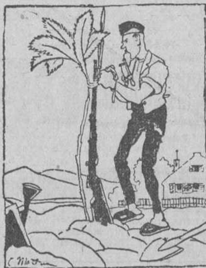
—Es un arbusto delicadísimo. Hay que ponerle un buen apoyo. (Ingend, de Munich.)