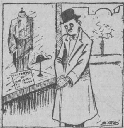
—La verdad es que me sentaría bien ese uniforme! (Correo Español, de Madrid.)