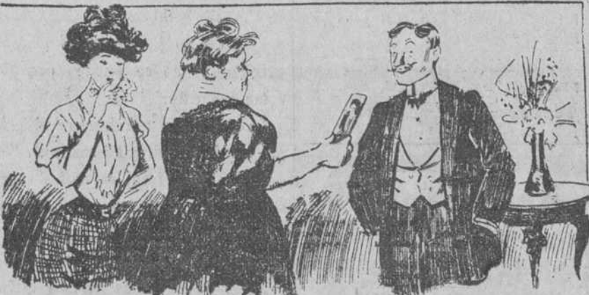
—Y este retrato, sin duda, será el de alguna de las pérdidas que usted trata? —Pero fíjese usted, mamá suegra. Es la efigie de la República vestida a la moda de ahora. (Frou-Frou, de París.)