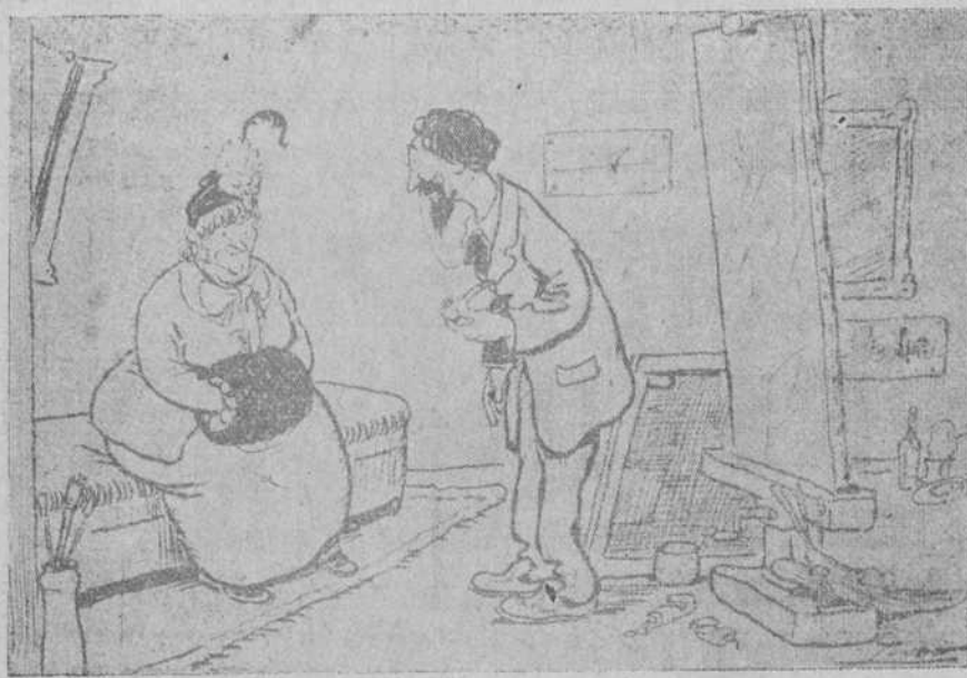
—¿Cuánto me llevará usted por mi retrato? —¡Ah, señora! Eso depende de la edad que quiera usted representar... (El Imparcial, de Madrid.)